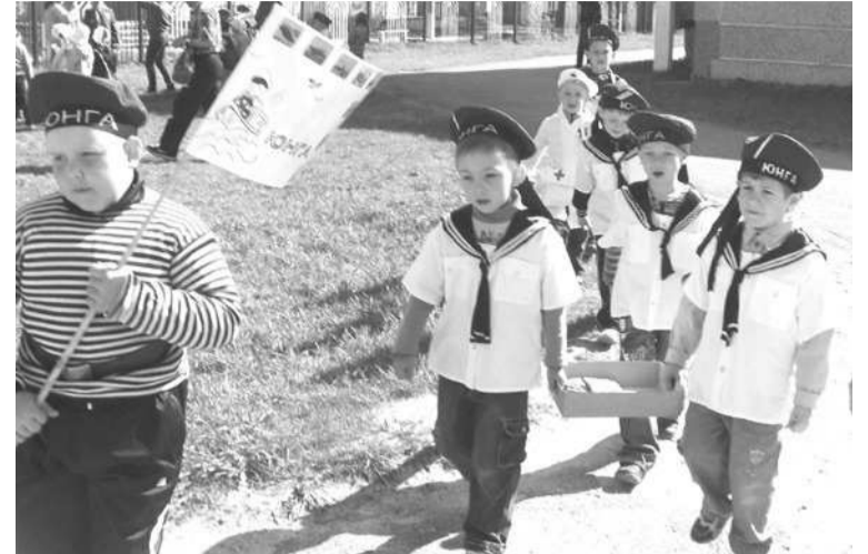
Юные «бойцы» ответственно выполняли приказ «генерала».