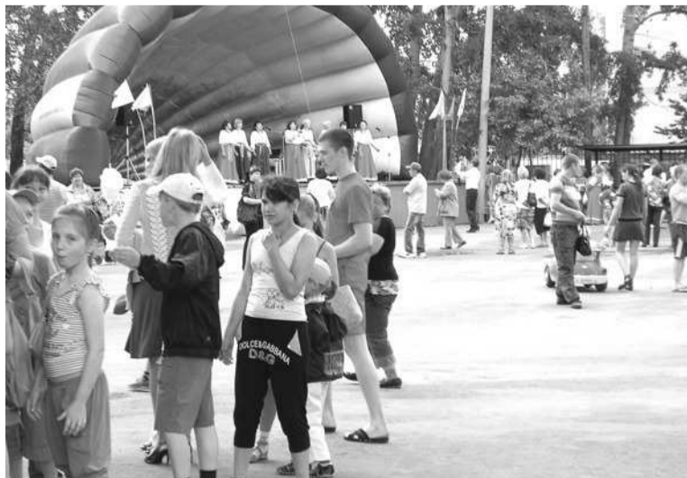
В День России в парке было оживленно.