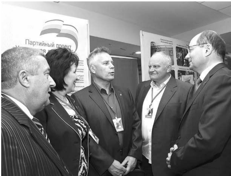
Идею создания народного фронта губернатор обсудил с делегатами конференции «Единой России».