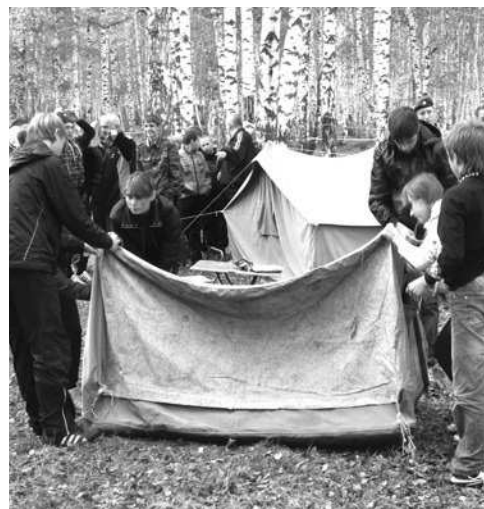
Туристы собирают палатку на время.

Погода для слета была самой благоприятной,