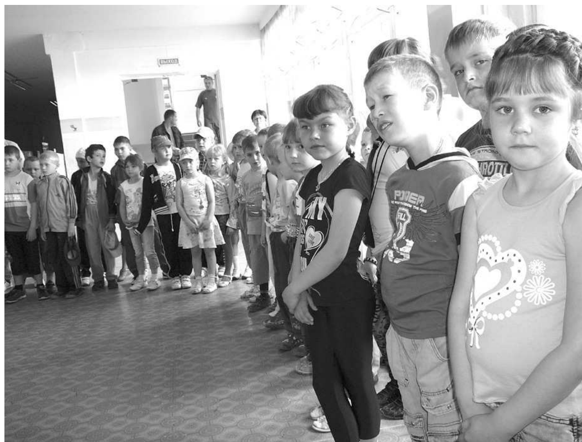
Каждое утро в лагере при школе № 2 начинается с линейки.