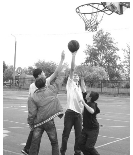
В число игр входил и стритбол.

Из проблем существует только одна — пока не организовано питание ребят.