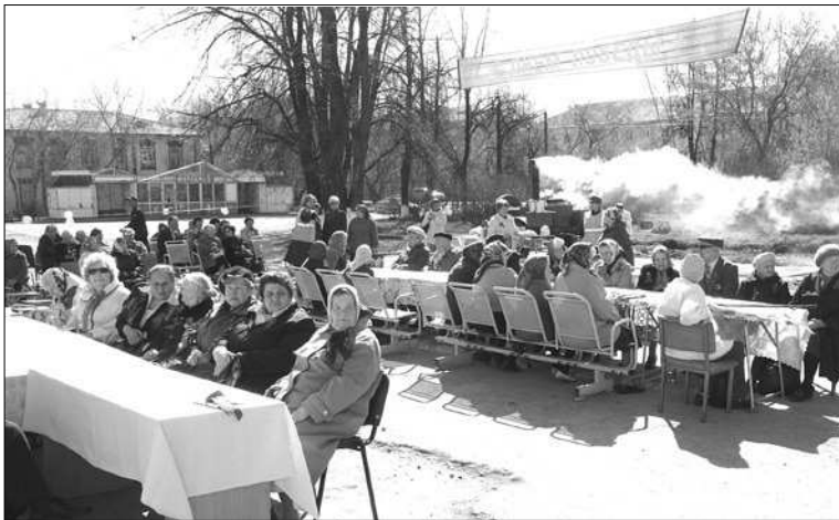
Ветераны-железнодорожники собрались на привокзальной площади.