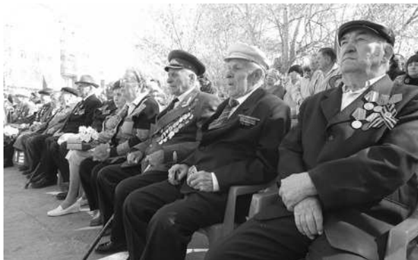
Ветераны – на почетных местах.

Под печальные звуки «Реквиема» начинается торжественная церемония