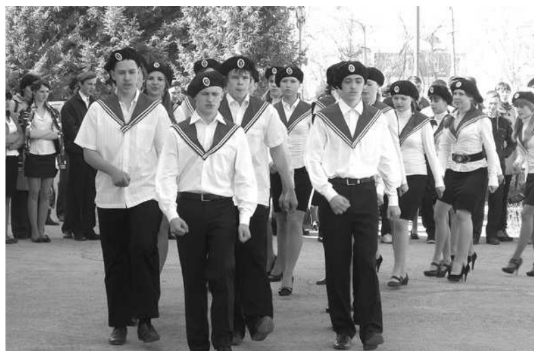
Ребята из пятой школы маршировали, как настоящие военные моряки.