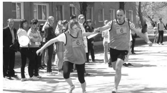
Передача эстафетной палочки командой Байновской сельской территории.

Среди учащихся 7-8 классов бронзу увезли ученики Байновской школы. Второе место заняли спортсмены третьей школы. А вот учащихся пятой школы, занявших первое место, приветствовали, как и подобает неоднократному победителю, бурными аплодисментами и криками. Поднимались они на сцену за золотом и по итогам забега среди учащихся 9-11 классов. Вторыми здесь стали ученики школы № 4, третьими – школы № 3.