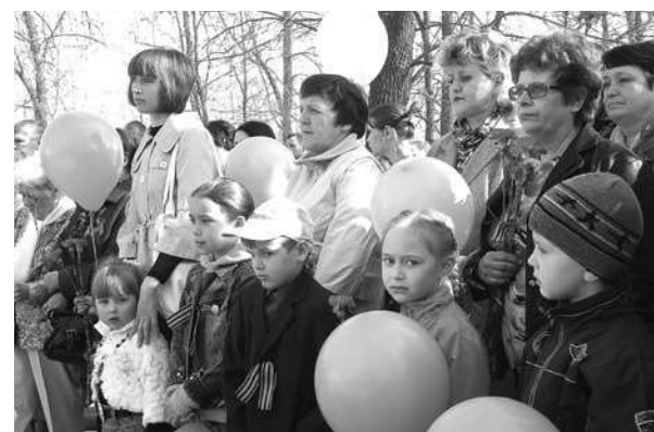
Огнеупорщики открыли череду праздничных митингов.