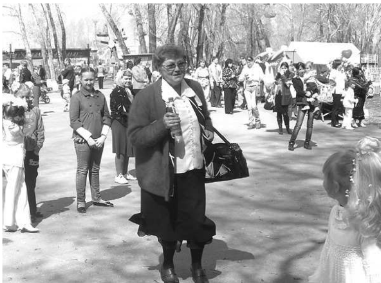
В парке было многолюдно и весело.

И какой же праздник в парке без игровой программы? Гостей парка развлекали разными играми, конкурсами, загадками. Не только ведущие праздника, но и ростовые куклы Кот и Заяц, которые прогули-