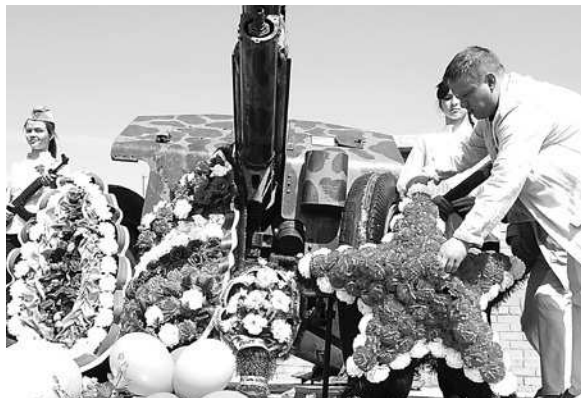
Возложение венков у памятника в Парке Победы.

и в тылу – великое множество», – подчеркивает глава.