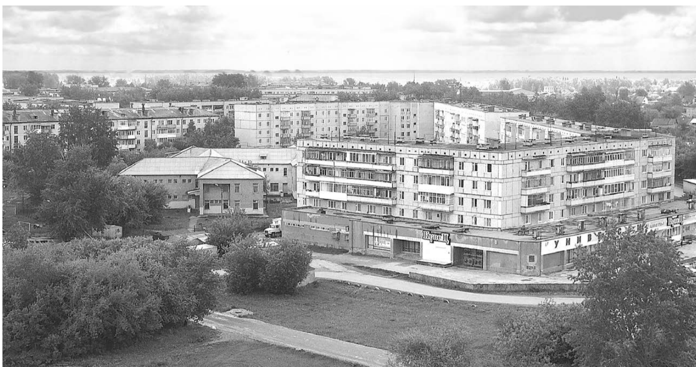
Панорама города с высоты строящейся девятиэтажки на Кунавина, 9.