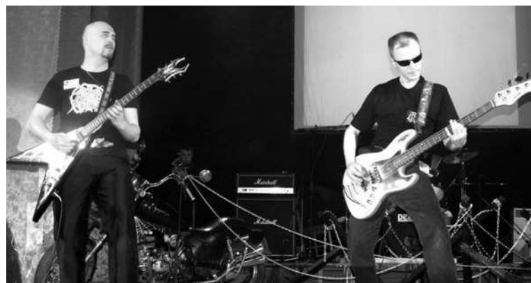
На сцене – рок-группа «Три Ада»