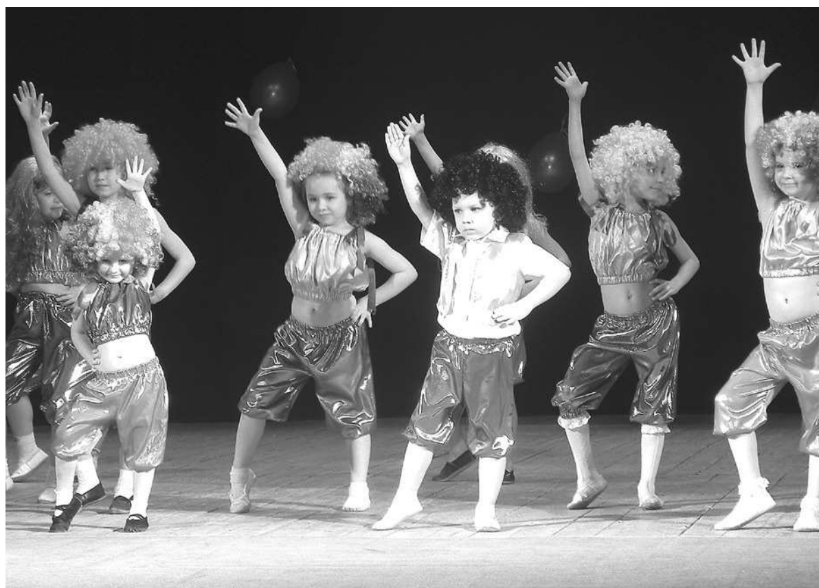
Малыши из танцевального шоу-проекта «Б-52» показали зрителям настоящее диско.