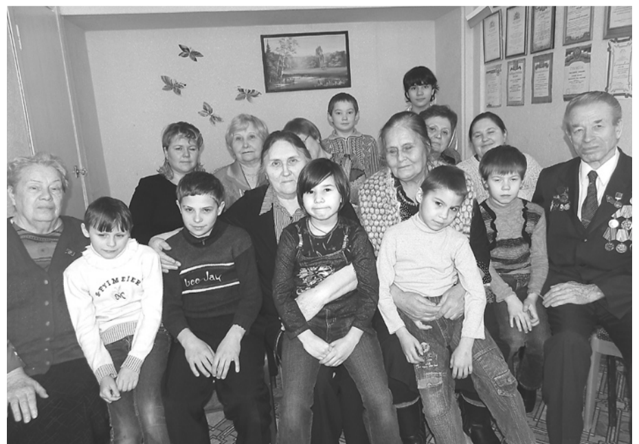
Два поколения встретились в совете ветеранов.