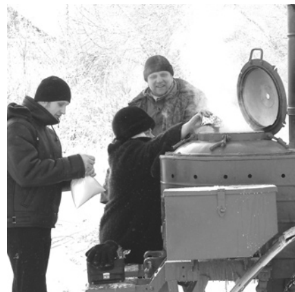
Чай заваривали прямо в котле.