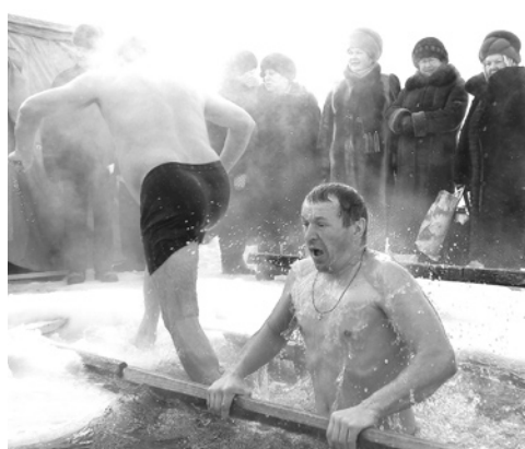
А мороз больше 20 градусов...