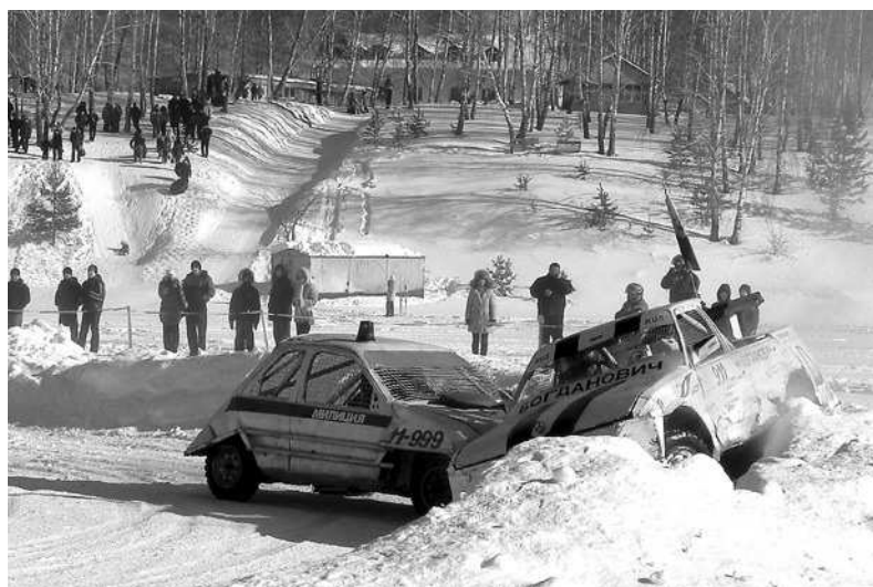
Удары автомобилей приводили зрителей в полный восторг.