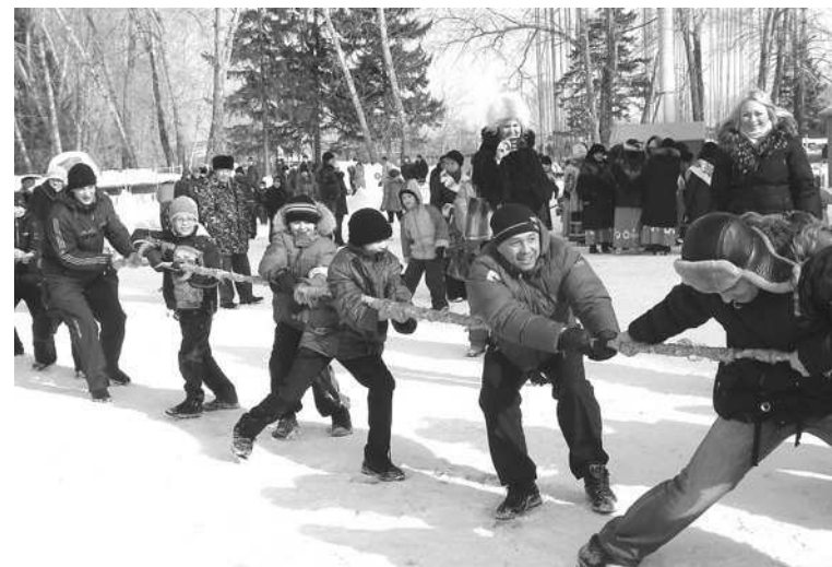
Многие хотели показать свою силу и удал в перетягивании каната.