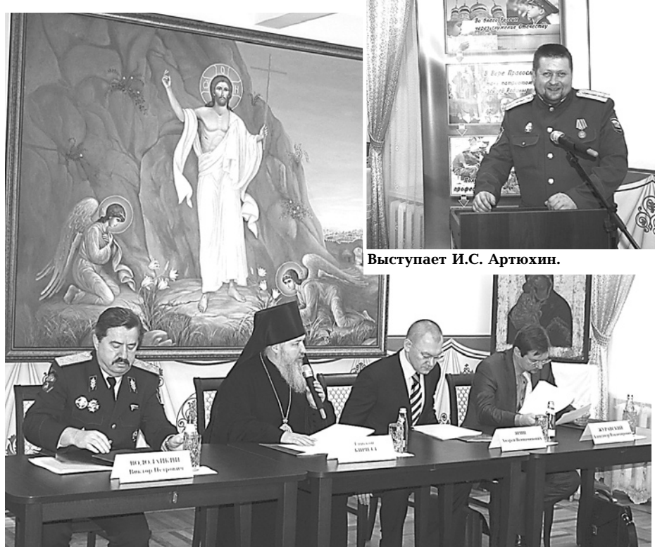
Идет занятие в секции «Церковь и казачество: реализация духовно-нравственных программ и проектов».