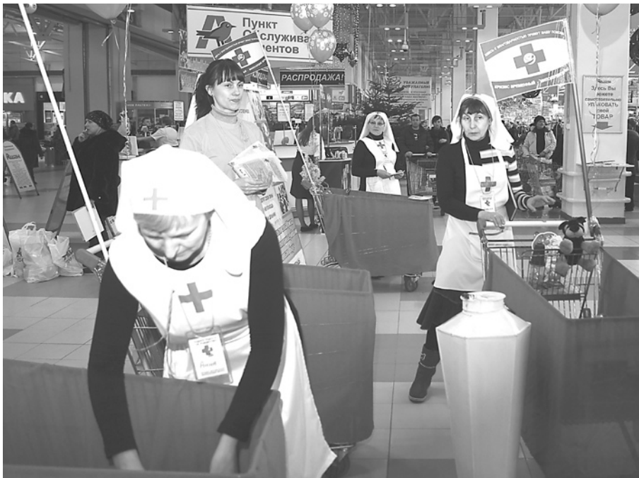
Участники акции собирают товары, пожертвованные покупателями.