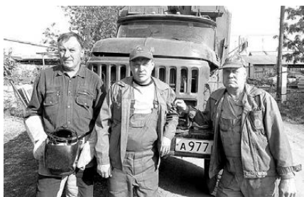
ГАЗОВИКИ ОТМЕЧАЮТ ПРОФЕССИОНАЛЬНЫЙ ПРАЗДНИК Стр. 3.