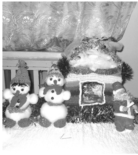
Зимний «уголок» выставки «Времена года».

Новогодние праздники подошли к концу, но воспоминания о шумных и веселых мероприятиях останутся на весь год. Как,