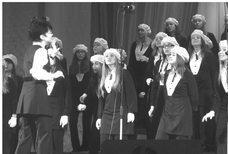
Джаз-хор очень понравился Богдановичцам.