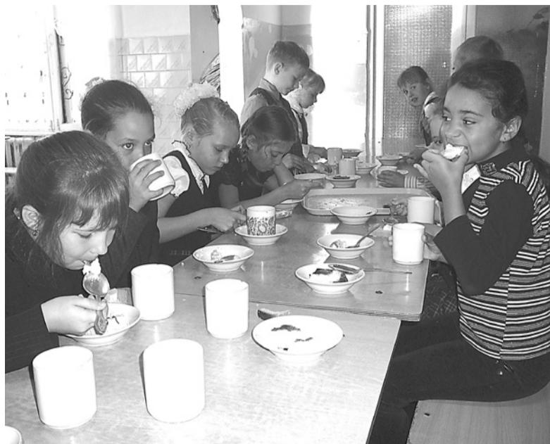
Завтрак начальных классов в школе № 5. Дети с удовольствием уплетают творожную запеканку.