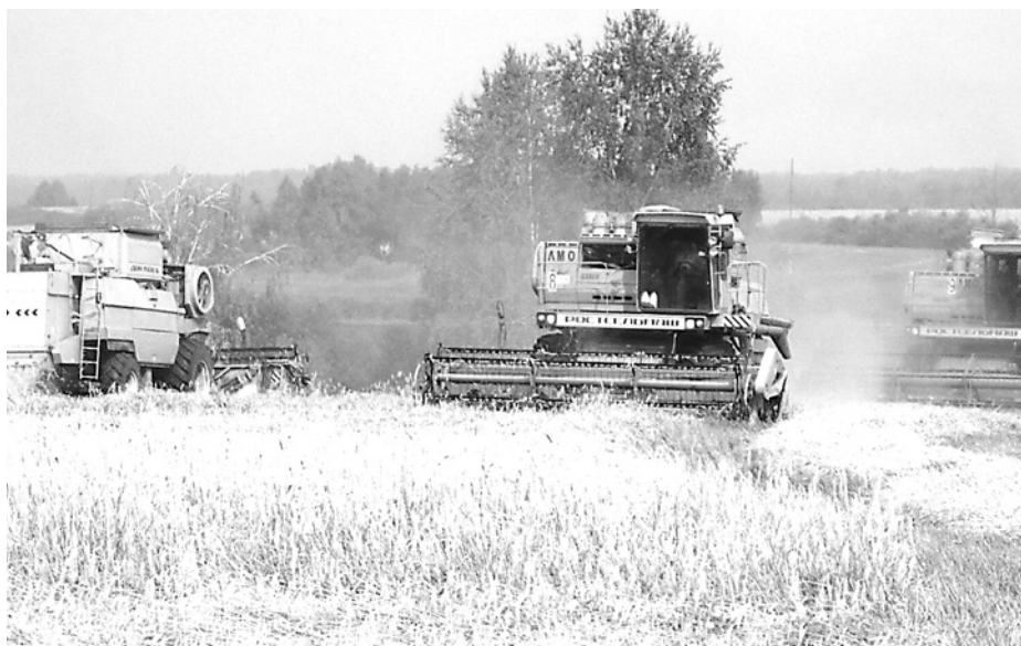
Зерноуборочные «Доны» СПК «Колхоз имени Свердлова» завершают обмолот зерновых культур.