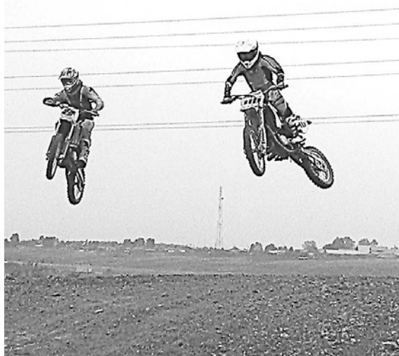
Выше всех над головами зрителей взлетали одиночки класса 250 кубических сантиметров.