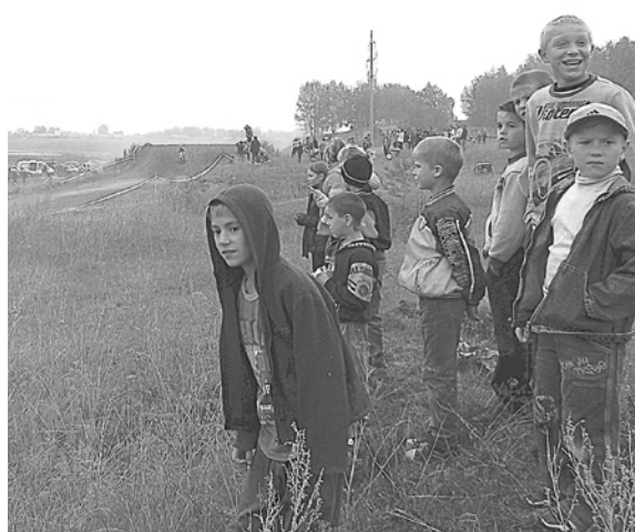
Богдановичские мальчишки – будущие мотогонщики восторженно следят за трассой.