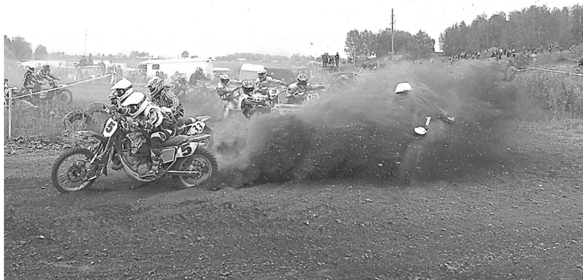
Старт главного заезда на кубок УрФО по мотоциклетному спорту – экипажи тяжелых мотоциклов, классов 650 и 750 кубических сантиметров.