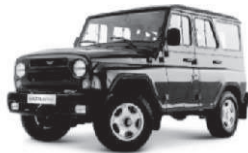
UAZ HUNTER от 430 тыс. руб.*