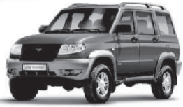
UAZ PATRIOT от 499 тыс. руб.*