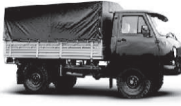
UAZ 33036 от 465 тыс. руб.*