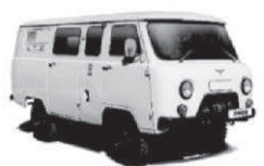
UAZ 39099 от 487 тыс. руб.*