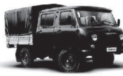
UAZ ФЕРМЕР от 487 тыс. руб.