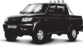
UAZ PICKUP от 558 тыс. руб.