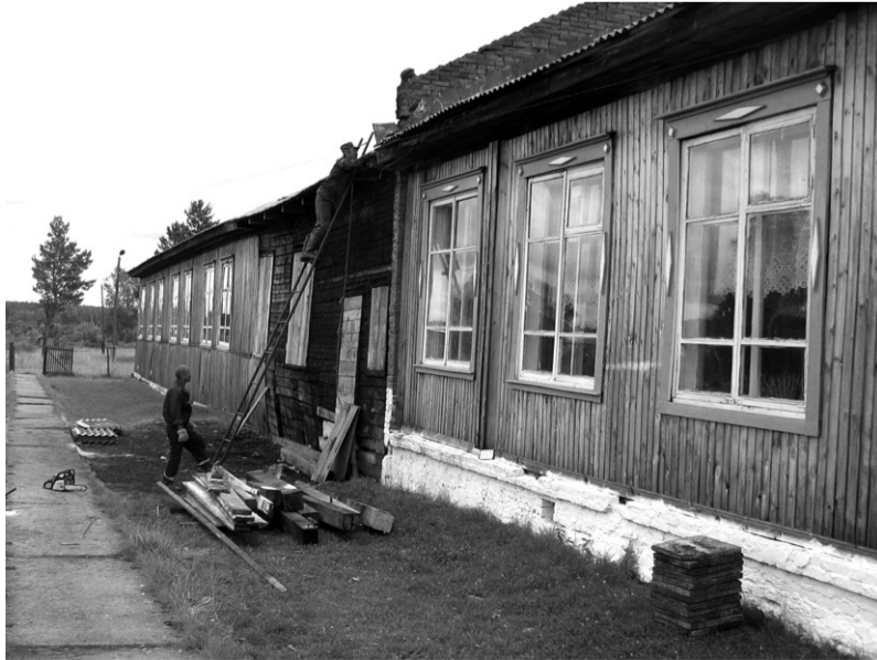
Пострадавшая от пожара школа