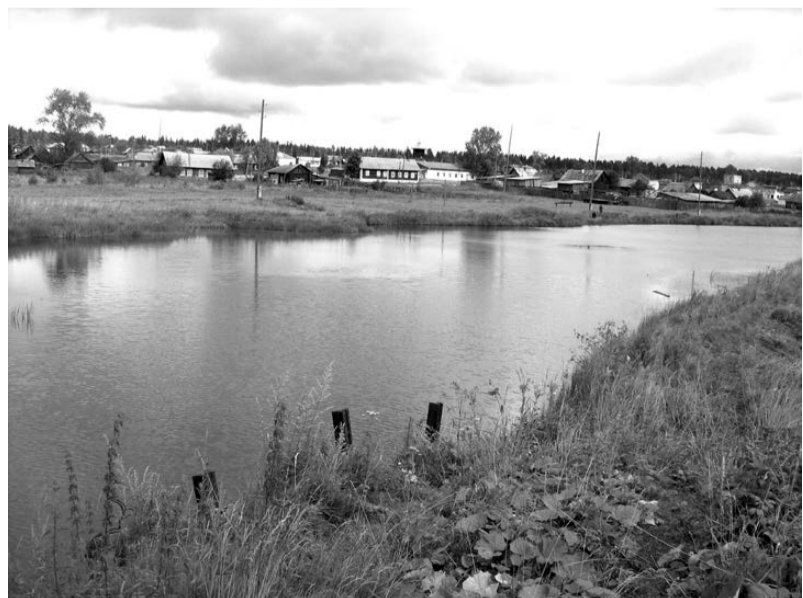
Вид на поселок Ясашная