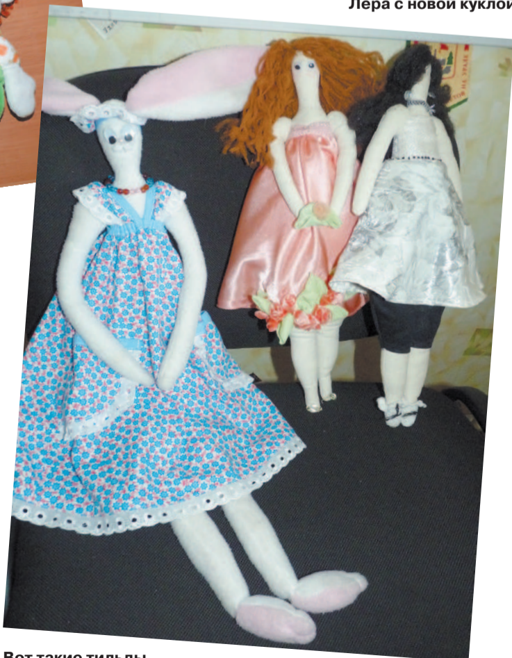
Вот такие тильды делают школьницы своими руками