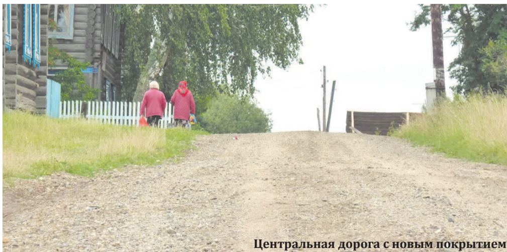
Центральная дорога с новым покрытием