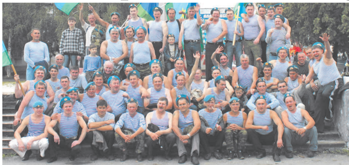
После митинга - снимок на память

2 августа в России отмечалась 81-я годовщина со дня образования Воздушно-десантных войск РФ. Эти войска называют по-разному: «голубыми беретами», «крылатой пехотой»