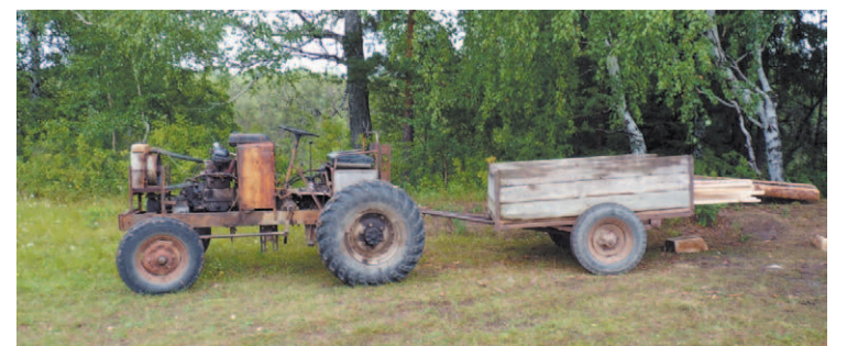
Вот такой тракторишко сделали умельцы своими руками