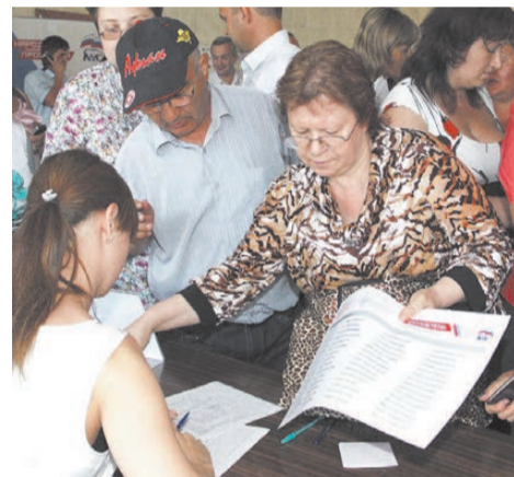
Кандидаты от «Единой России» должны заручиться поддержкой земляков

В этом году лидер партии «ЕДИНАЯ РОССИЯ» Владимир Путин принял принципиальное решение - четверть мест, в списках