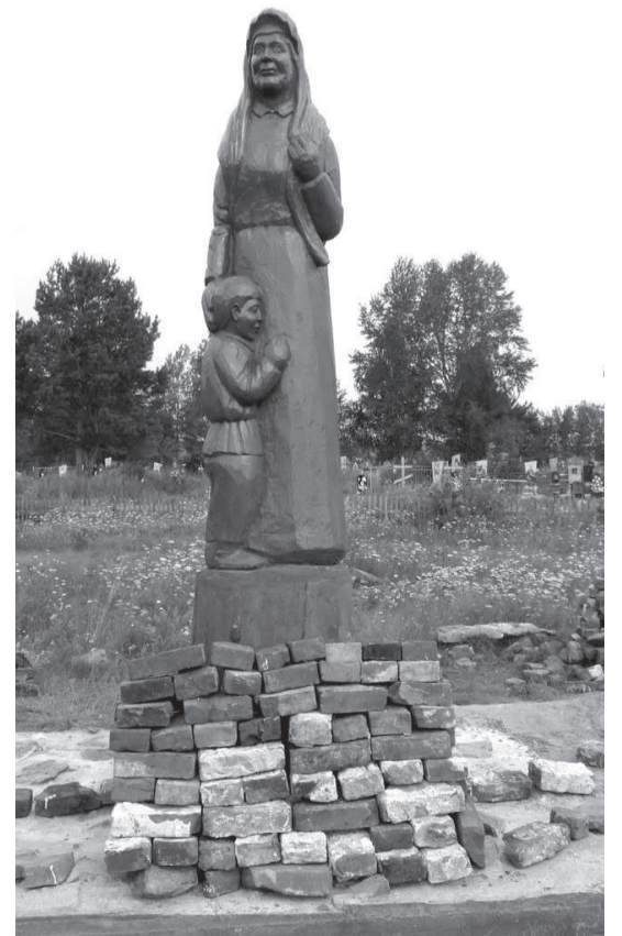
До открытия памятника осталось немного...