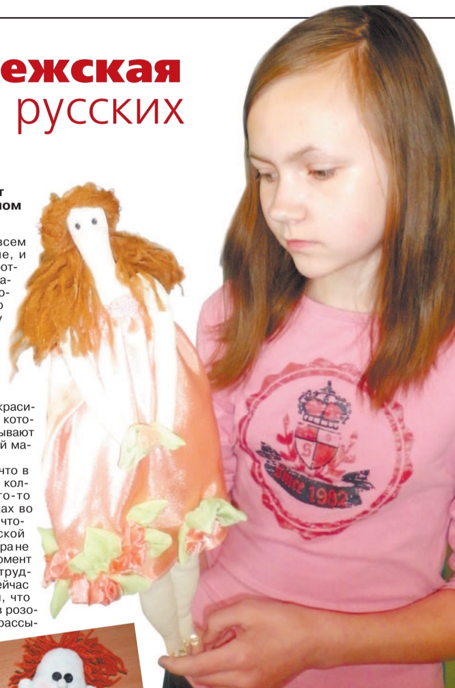
Лера с новой куклой

Ольга СИМОНОВА