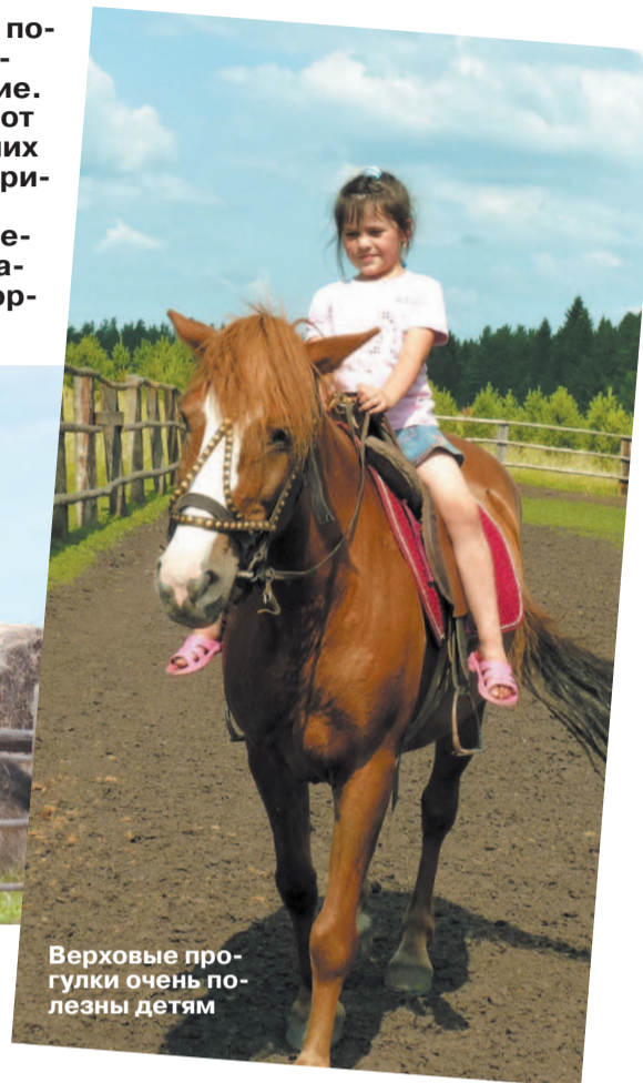
Верховые прогулки очень полезны детям

А вот и Верхнесинячихинский конный двор. Очеред-