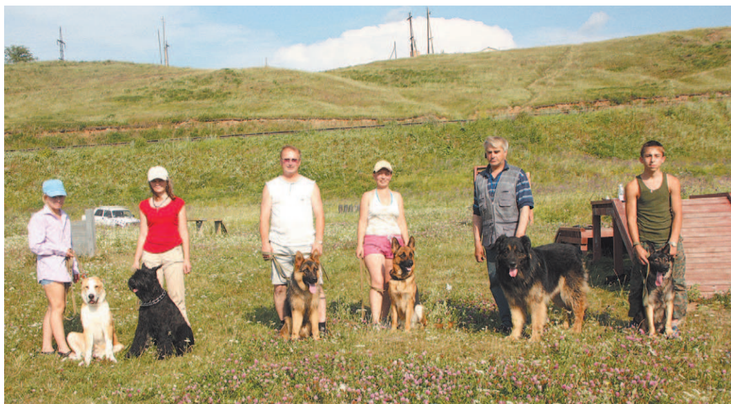
В выходной день на тренировочной площадке