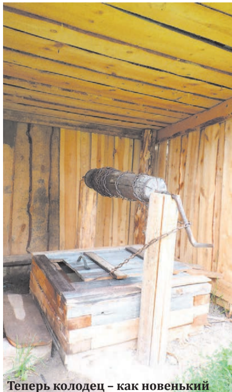
Теперь колодец — как новенький