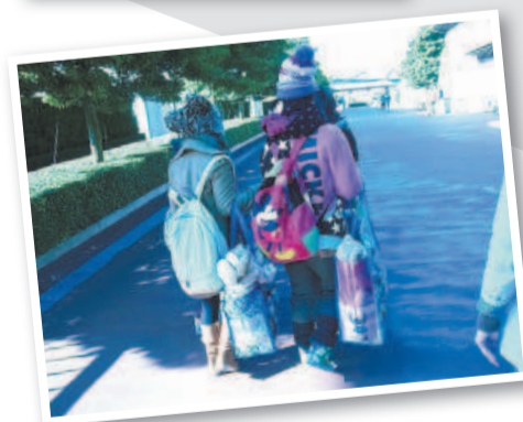
На этом снимке совершенно взрослые люди, а кажется впали в детство. На мой взгляд, это любимый стиль одежды японцев.