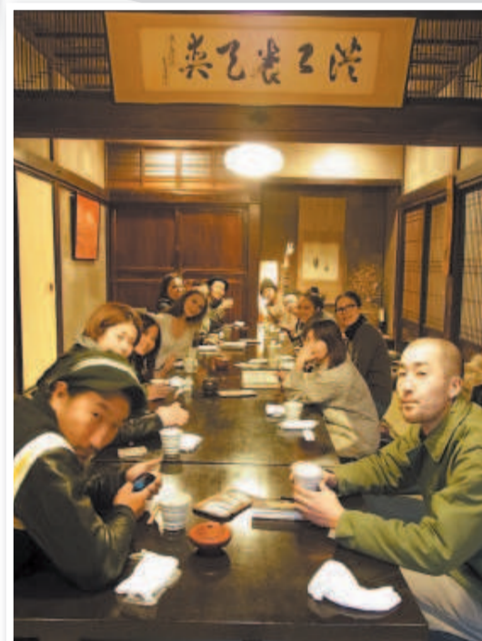
Обед со съёмочной группой в национальном ресторанчике за городом тоже яркое событие.