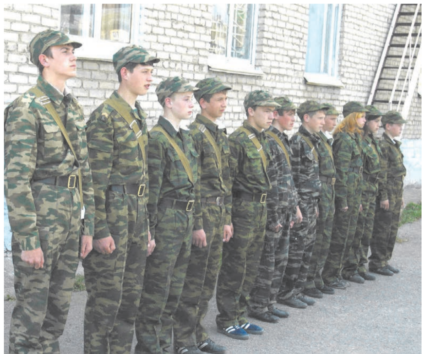
Воспитанники военно-патриотического клуба «Звезда»