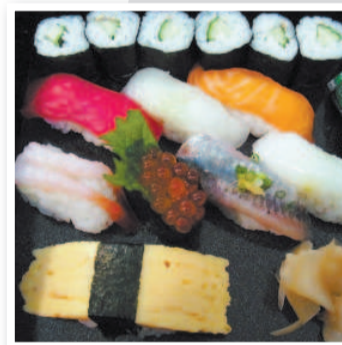
Таких суши, как в Японии, вы не встретите нигде. Они не сравнятся с теми, которые подают в русских суши-барах. ОООООЧЕНЬ ВКУСНО!