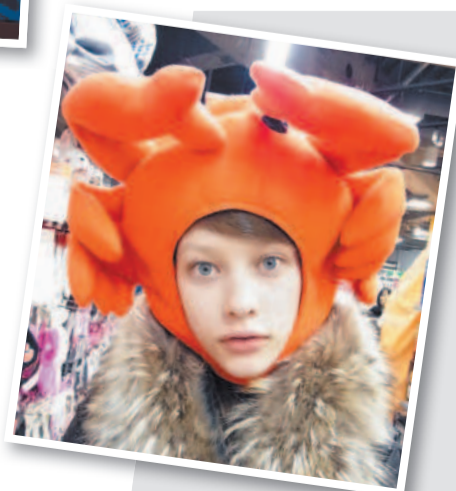
В огромном магазине я наткнулась на шапку в виде краба. Не удержалась и примерила ее. А потом не удержалась и сфотографировалась в ней.