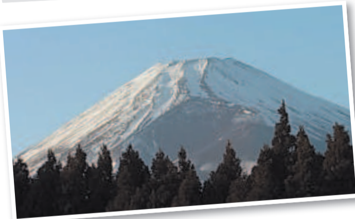
Одна из натуральных съёмок происходила у подножия Фудзи. Сфотографировать главную достопримечательность Японии - вулкан Фудзияма (в европейской транскрипции) нужно обязательно.