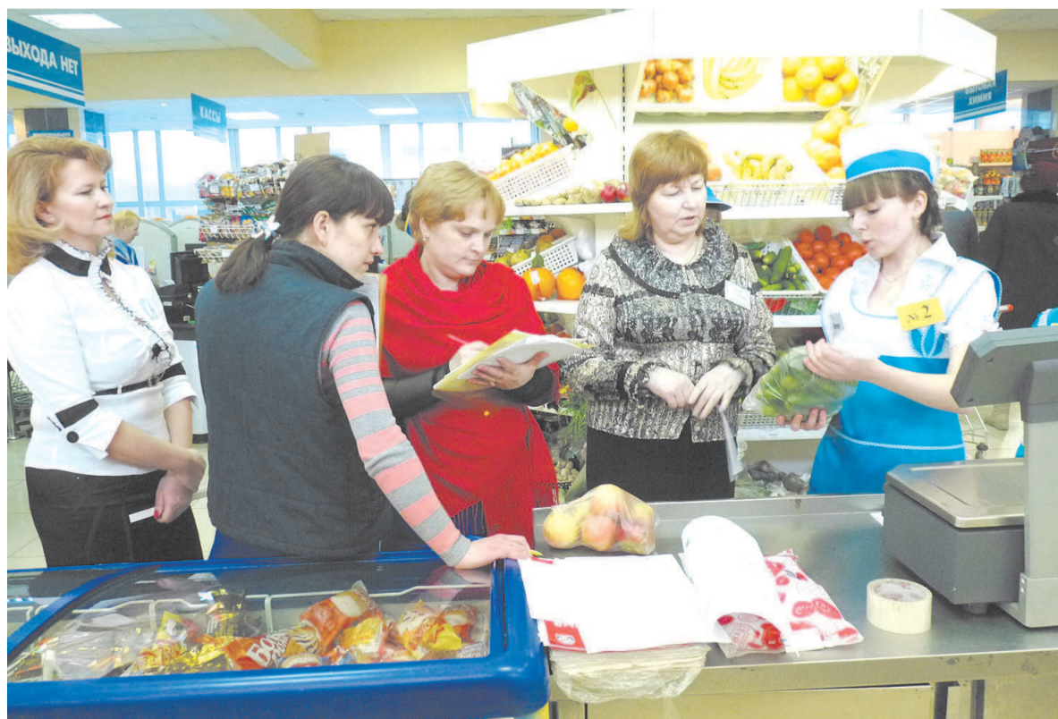
Практический этап конкурса продавцов проходил в магазине «Сотка»

Олег КОСТРОМИН