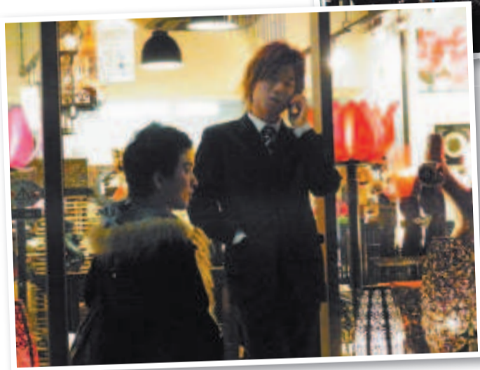
Токио буквально переполнен яркими персонажами. Каждого из них хотелось запечатлеть на камеру. Молодые японцы вызвали у меня много позитивных эмоций.