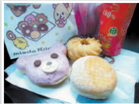
Однажды перед съёмкой мой стилист завёл меня в магазин пончиков и купил мне целый пакет. Пончики были очень красивыми и безумно вкусными — пальчики оближешь.