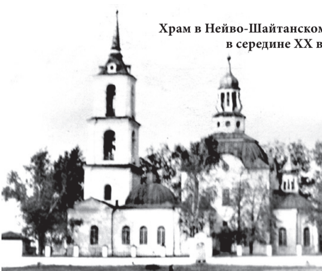
Храм в Нейво-Шайтанском в середине XX в.

А. ВОЛИНА, п. Н.-Шайтанский