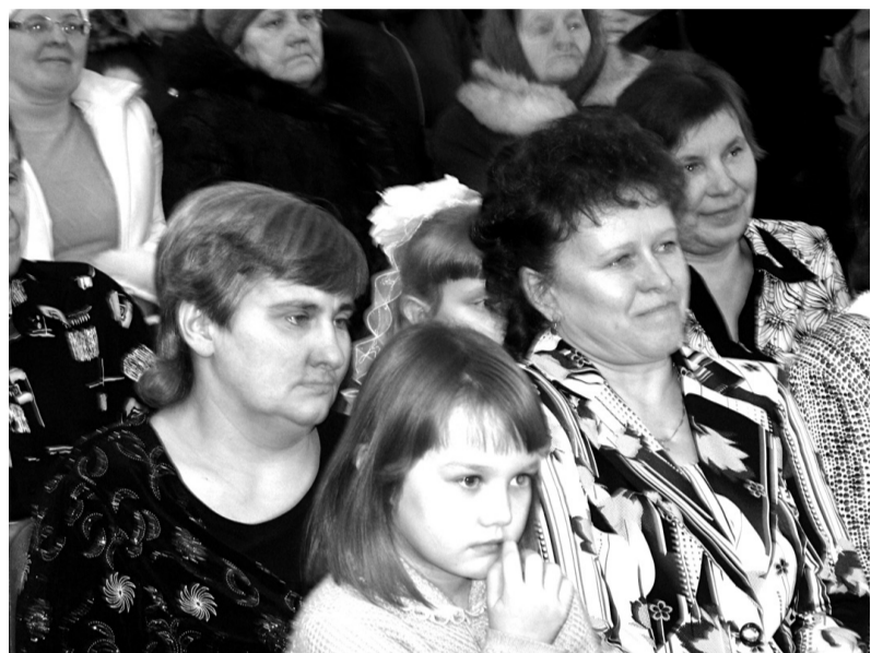
Коллективу садика есть кем гордиться