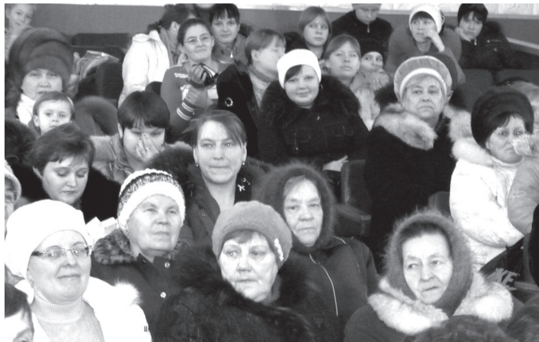
На юбилейный концерт, посвященный 25-летию детсада «Светлячок», пришло едва ли не все Голубковское

муниципального образования, здесь проблема нехватки мест в детском саду не так остра, но если существует возможность проблему устранить совсем, то почему бы это не сделать? Решено — сделано! В минувшем году силами сотрудников детсада и за счет средств местного бюджета была проделана колоссальная работа по ремонту пустующих помещений и размещению в них дополнительной группы для самых маленьких очередников. В этом году садик прошел процедуру лицензирования и получил довольно высокую оценку лицензионной комиссии. Уже 1 сентября 2011 года новая дополнительная группа примет своих воспитанников и начнет работу. Получается, нынешний юбилей — дата знаковая, поскольку знаменует собой очень добрый знак: в Голубковском есть дети, а это значит, что у села есть будущее.