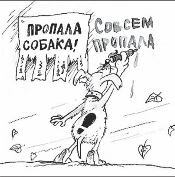
Карикатура с сайта: http://caricatura.ru .

10 ОКТЯБРЯ в редакцию позвонила женщина и рассказала, как в присутствии нескольких прохожих, среди бела дня, мужчина выстрелил в собаку. Разборка между человеком и псом произошла на площадке перед профессиональным лицеем №22. По словам женщины, собака хоть и была бездомной, но давно жила в окрестностях дома №29 по улице Декабристов. Женщина отметила необычность оружия стрелка. Звук от выстрела был едва слышен, а собака от попадания «пули» не упала, а стремглав убежала, оставив за