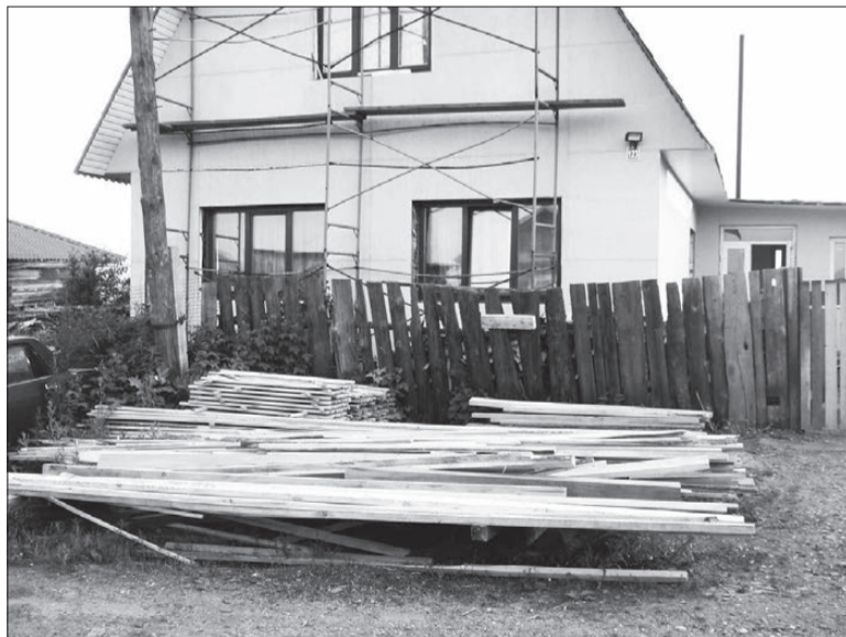
Согласно договору о возведении индивидуального жилого дома на праве личной собственности на отведенном земельном участке застройщик должен был построить одноэтажный деревянный жилой дом.

Мировой судья, рассмотрев административное дело, установил, что в протоколе об административном правонарушении отсутствуют объяснения потерпевшей. Сами