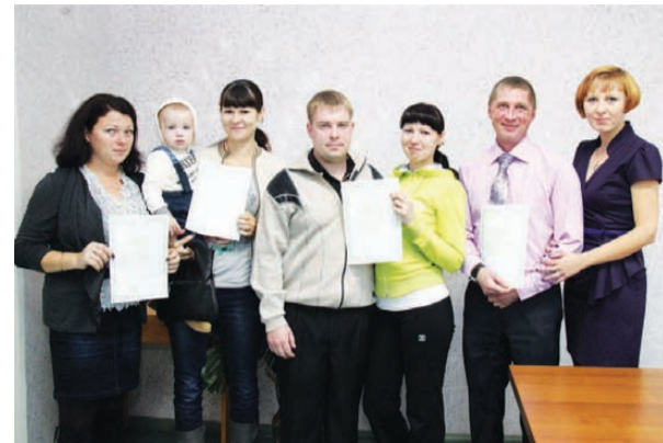
Осталось лишь купить квартиры.

В МИНУВШИЙ вторник в администрации НТГО состоялось вручение свидетельств на получение социальных выплат семьям, участвующим в муниципальной целевой программе «Обеспечение жильем молодых семей в НТГО на 2011-2015 гг.».