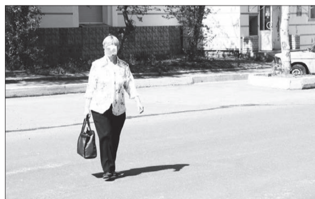
«Мне так ближе, и машин ведь нет...».