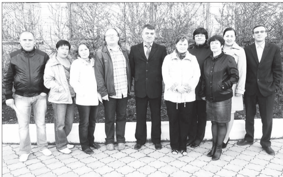
Коллектив филиала «Нижнетуринское БТИ».

В том же 2001 году возникла необходимость в инвентаризации производственных предприятий. До этого периода не существовало инструк-