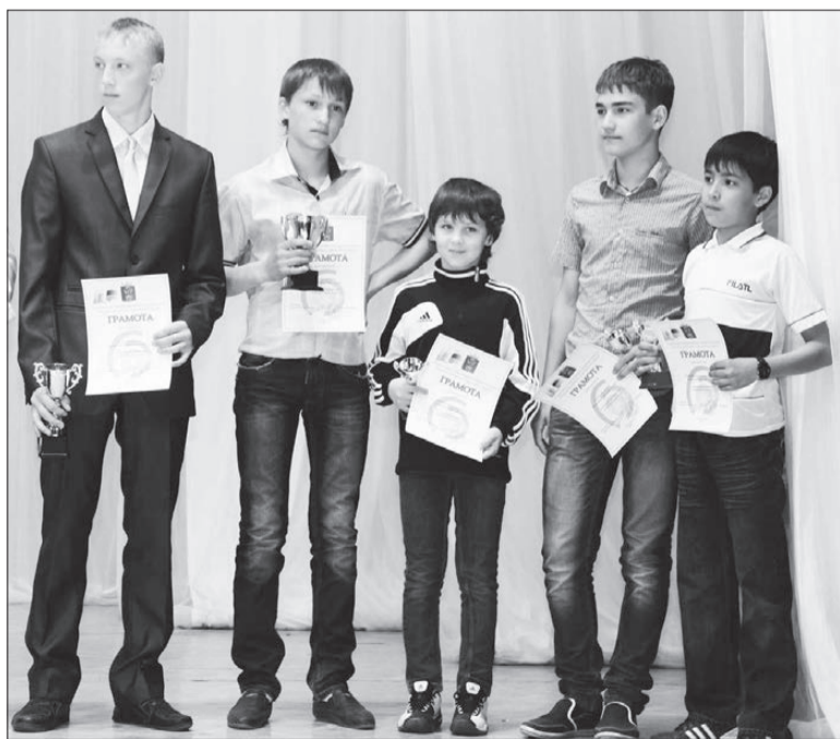
Юные спортсмены добились хороших успехов.

НА СВЕТЕ много формул разных. Каждый школьник и студент изучает несметное их количество на уроках. Но есть