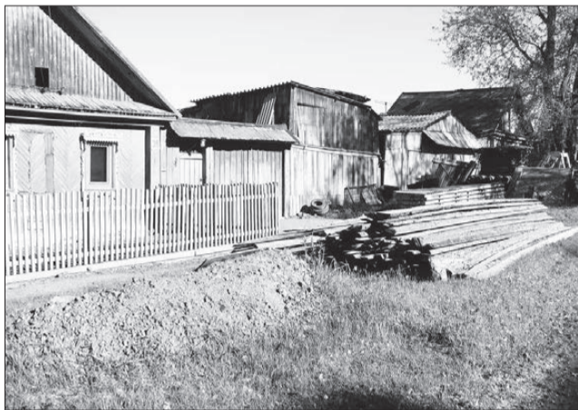
Сложено аккуратно, но на городской территории. В случае возгорания огнеборцам к такому дому не подобраться.