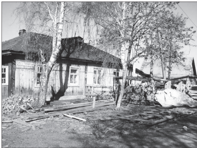
Хозяин одной половины дома ничем не занимается, владелец другой – фермерством, но результат один – беспорядок.