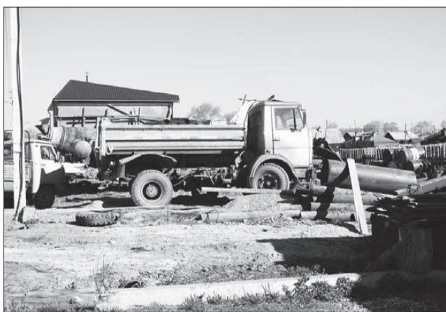
Металлическое «кладбище» – за забор!