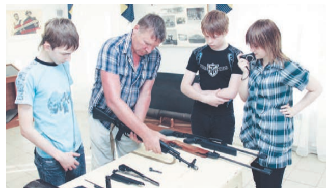
Посетители музея могли разобрать экспонаты на части.

Фоторепортаж размещен на сайте http://vremya-nt.ru