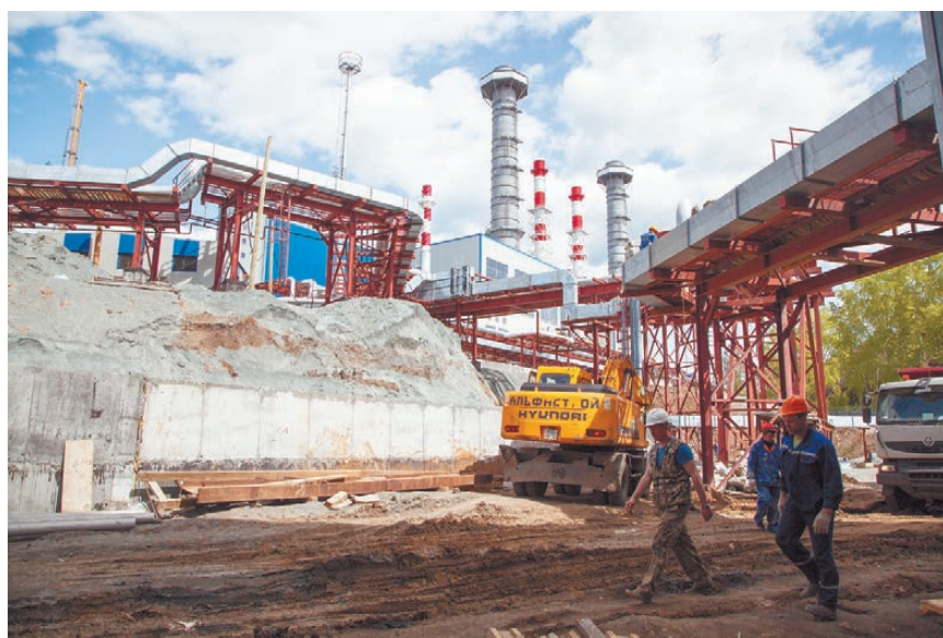
Водосберегающий проект Нижнетуринской ТЭС получит государственную поддержку.

Система подачи воды на ТЭС имеет специальную конструкцию, которая не позволяет рыбе прони-