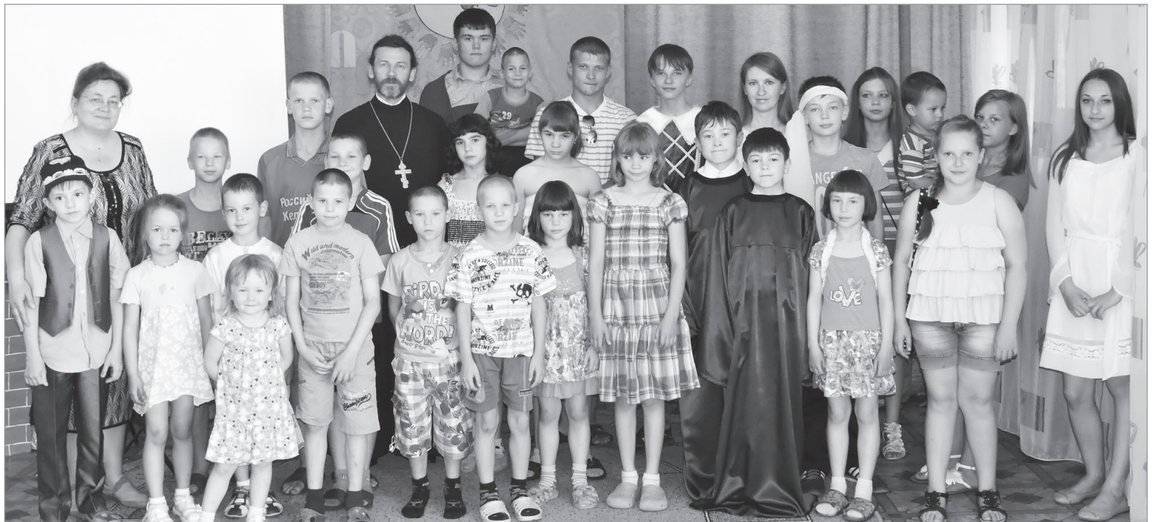
Участники встречи «Образ князя Владимира в кинематографе и мультипликации».

ПОЗНАКОМИТЬСЯ с событиями 1000-летней давности удалось ребятишкам из детского дома и воскресной школы «Илиотропион», а также прихожанам храма святителя Иоанна митрополита Тобольского.