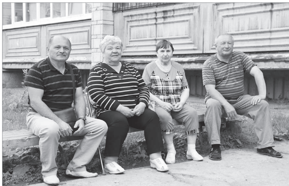
Теперь большинство вопросов по содержанию дома обсуждается на этой скамейке при участии жильцов.

Первым был установлен в этом доме общедомовой прибор учета электроэнергии. Поначалу его появление радости особой не принесло — на общедомовые нужды он «наматал» 3000 кВт. Стали разбираться и выяснили, что причиной перерасхода стали бесконтрольно горящие в подъездах и на фасаде лампы освещения. Опять же из сэкономленных средств купили и смонтировали датчики движения и звука, автоматически включающие и отключающие освещение. И как результат — ОДН по электроэнергии снизились до 500 кВт. А в квитанциях у собственников ОДН по электричеству теперь не более 20 рублей в месяц.