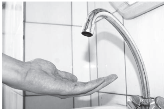
Так надолго без горячей воды мы остались впервые.

- Более чем половине жителей нашего округа в июне пришли квитанции красного цвета по оплате жилья и коммунальных услуг. Так