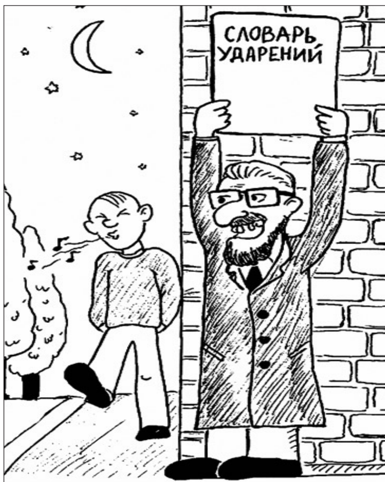
Иллюстрация с сайта http://caricatura.ru .