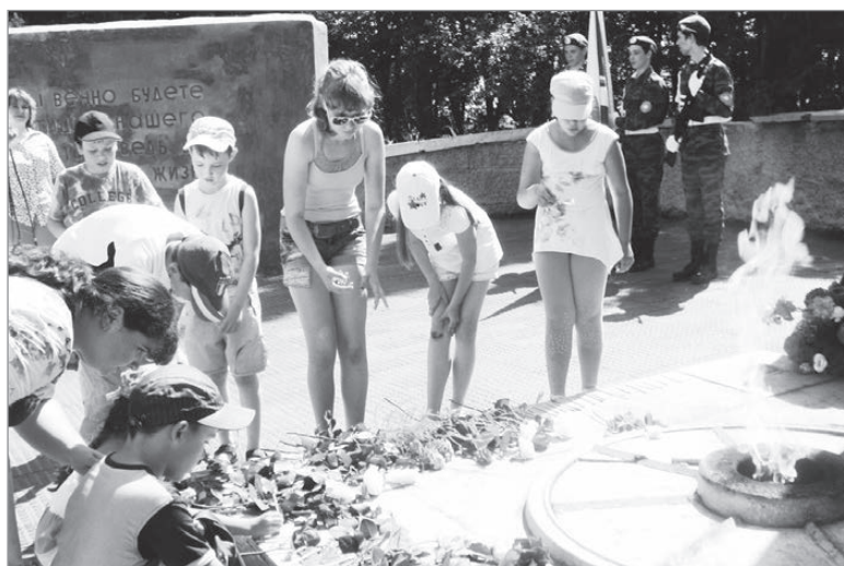
Подвиг солдат Великой Отечественной живет в памяти поколений.