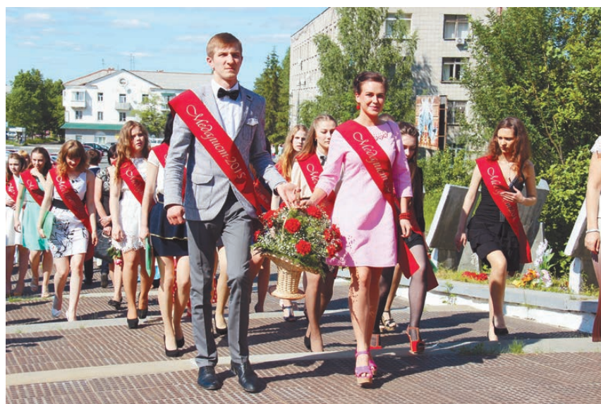
Медалисты возложили цветы к мемориалу.