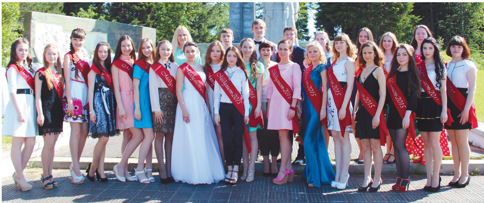
Медальями «За особые успехи в учении» награждены 25 выпускников.

25 нижнетуринских школьников награждены в этом году медалью «За особые успехи в учении». Чествование отличников состоялось на прошлой неделе в администрации Нижнетуринского городского округа.