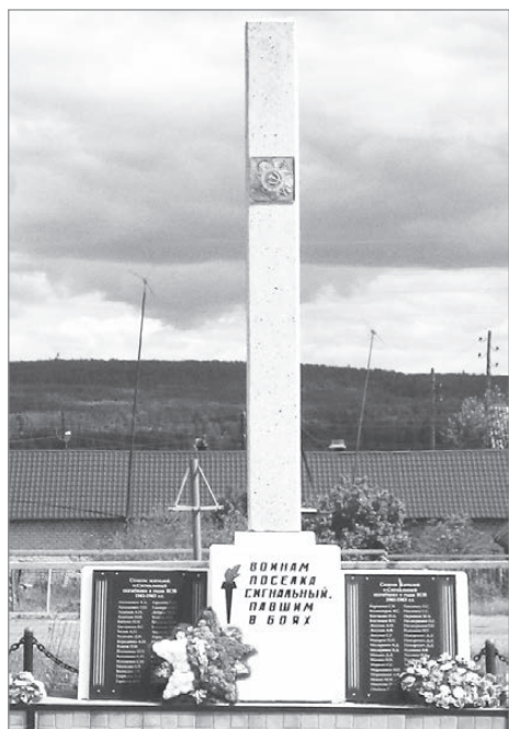
На мемориале в п. Сигнальном старатели восстановили таблички с именами.