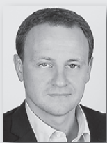
Александр Сидякин, руководитель партийного проекта «Школа грамотного потребителя» на федеральном уровне, председатель комитета Государственной Думы по жилищной политике и ЖКХ:

В Свердловской области с прошлого года реализуется проект «Школа грамотного потребителя» Всероссийской партии «Единая Россия». Его задача – повысить грамотность жителей в сфере жилищно-коммунальных услуг, сформировать новый класс потребителей – равнодушных, готовых отстаивать свои права, способных участвовать в формировании комфортной среды проживания. На территории нашей области проект реализуется совместно с региональным министерством энергетики и ЖКХ.