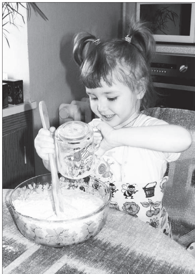
Юных хозяйшек нужно учить готовить не пироги, а овощи.

Помните, мультяшный кот Матроскин учит дядю Федора правильно есть бутерброд с колбасой? Этот аппетитный эпизод сегодня сгодился бы для рекламного ролика. Во времена создания мультипликационного фильма колбаса производилась согласно ГОСТам из мяса, и лишь в колбасы второго сорта добавляли немного муки и крахмала. Но сегодня под волшебным словом «мясо» производитель подразумевает соевый белок и эмульсию — кожу, субпродукты, отходы мясопроизводства. Чудеса пищевых технологий позволяют выпускать колбасу, в которой нет ни грамма мяса. Однако мы по-прежнему любим колбаску и, что еще хуже, кормим ею детей. Особо рьяные почитатели продукта рекомендуют дошкольным работникам отварить сосиски и не мудрить несъедобные, по их мнению, запеканки. Находятся родители, которые искренне недоумевают: почему детей не кормят пельменями, оладушками и блинами? Наверное, они до сих пор не знают, что хитовые блинчики и оладьи жарятся. Утвержденные в октябре 2010 года СанПиНы не одобряют такой способ приготовления и диктуют поварами: еда должна проходить через духовой шкаф. Пищевые блоки детских дошкольных учреждений работают на сырье, причем, на сырье охлажденном, а не на замороженном, поэтому пельменям и другим полуфабрикатам вход закрыт. Если бы папы и мамы более серьезно подходили к вопросу детского питания, то сегодня они били бы