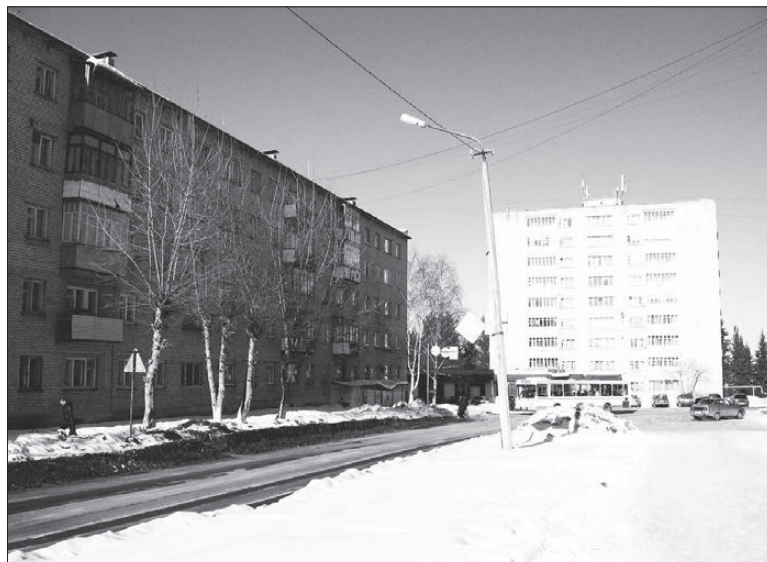
В каждом доме мы сами можем навести порядок.

— А кому платить? — спросите вы. Что вообще делать? Выход есть. Он, к сожалению, в такой мутной воде единственный: крепко задуматься и вникнуть в положение вещей самим — конкретно каждому и общими