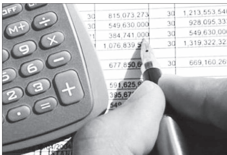
Расходов будет больше на 17%.

В связи с передачей полномочий по организации оказания медицинской помощи населению от муниципальных образований на уровень субъекта, расходы областного бюджета на здравоохранение выросли на 70 процентов или до 33,8 миллиарда рублей. Доля расходов на здравоохранение выросла с 16 до 23 процентов от общей суммы расходов. Так 116 муниципальных учреждений здравоохранения, за исключением учреждений города Екатеринбурга, передаются в государственную собственность Свердловской области. Органы местного самоуправления Екатеринбурга наделяются соответствующим полномочием Свердловской области, и финансовое обеспечение медицинской помощи в городе Екатеринбурге будет осущест-