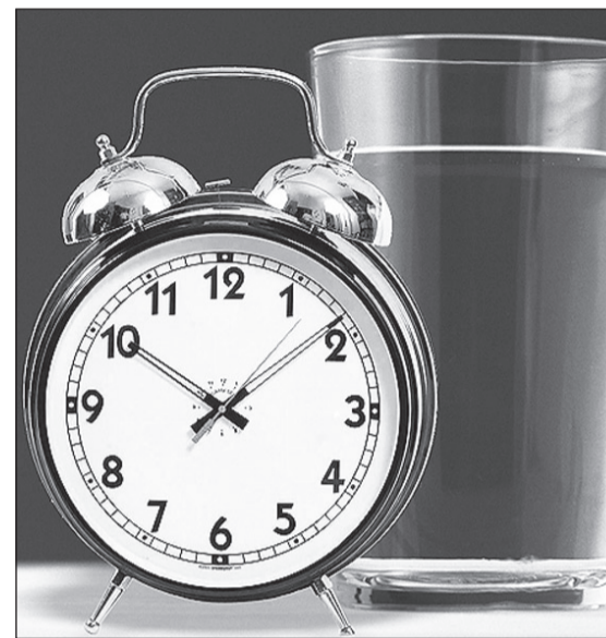
Ведите учет времени отсутствия воды и требуйте перерасчет.

мер платы, исчисленный суммарно за каждый день отклонения давления.