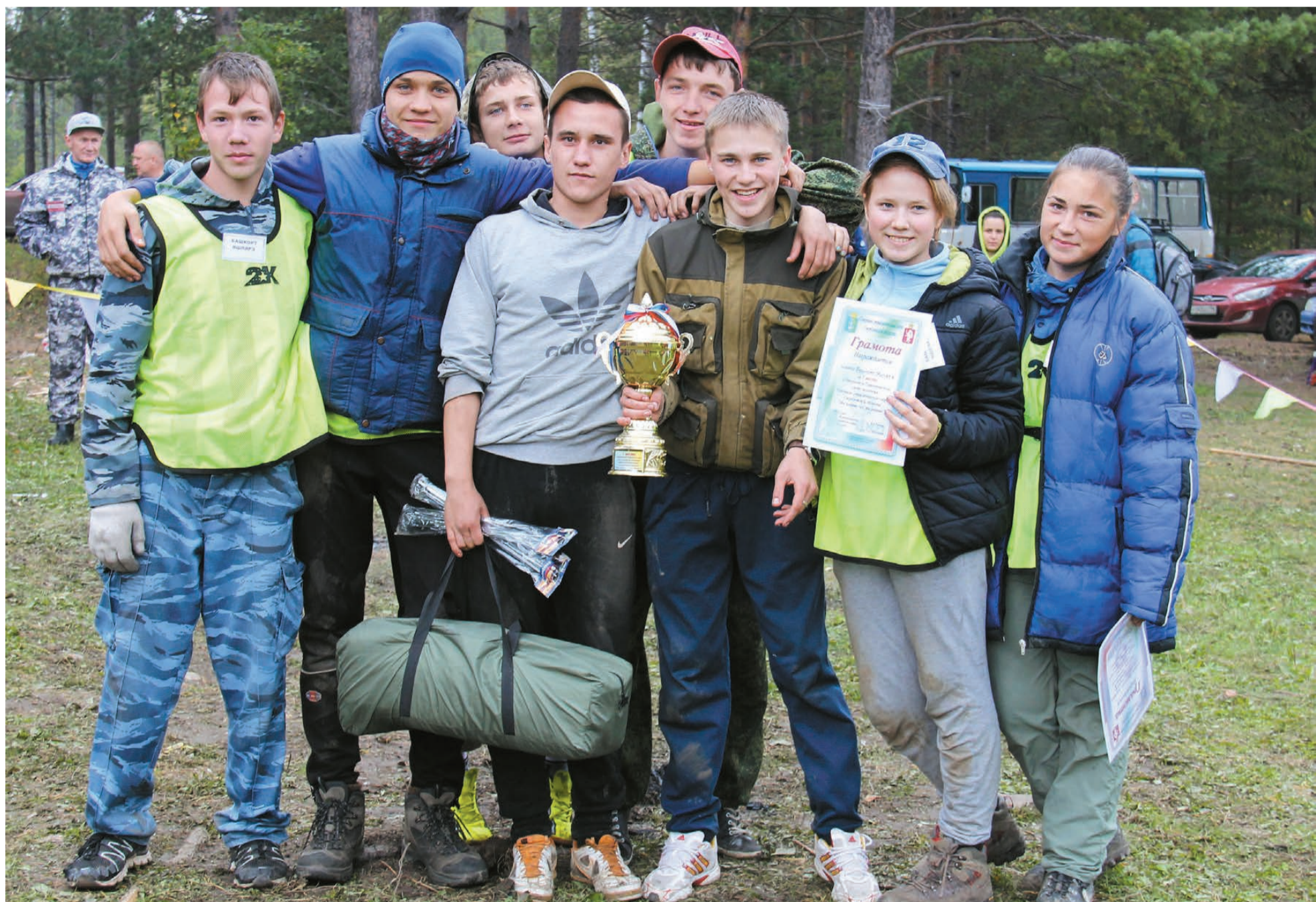
Победитель туристического слета «Мы разные, все мы равные» - команда «Башкорт яшляр» (поселок Ис).

Перепись населения, проведенная в 2010 году, в очередной раз доказала, что Россия является одной из самых многонациональных стран мира. Татары и украинцы, башкиры и чуваш, армяне и немцы... Всего переписчики насчитали на российских просторах 194 народности. Многие из них бережно хранят свою историю, язык, веру и традиции. Но, пожалуй, самое ценное, что есть у нас всех, — это взаимопонимание и добрососедские отношения.