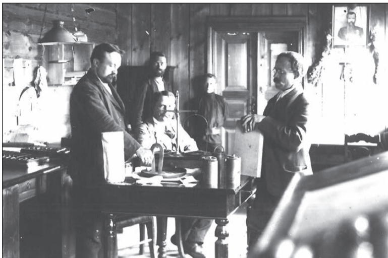
Прием металла в золотоскупке. 1920 год.

Во второй половине 20 века труд, быт и жизнь старателя изменились. Золотодобычей стали заниматься мощные, хорошо механизированные трудо-