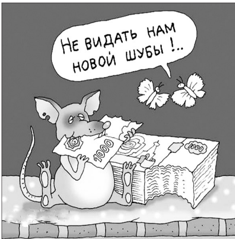
Иллюстрация с сайта http://caricatura.ru .