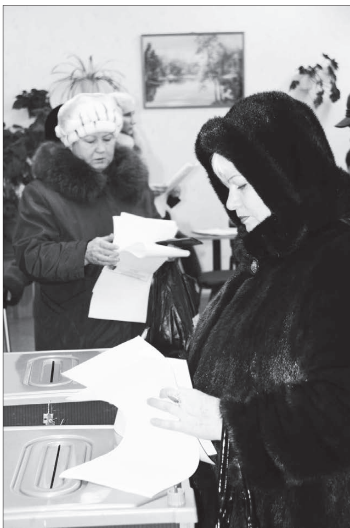
В этот день каждый думал о будущем страны.

Интересно, что наибольший процент голосов по округу избиратели отдали «Единой России» в поселках Платина и Сигнальный. «Справедливая Россия» лидировала у избирателей в