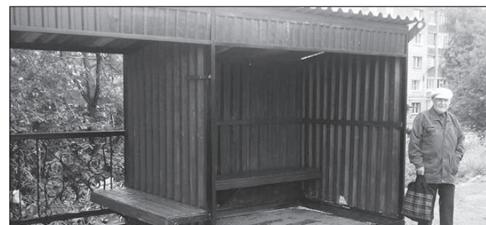
После ремонта остановочный комплекс приобрел опрятный вид.

Интервью вел Василий БУКОВКИН.