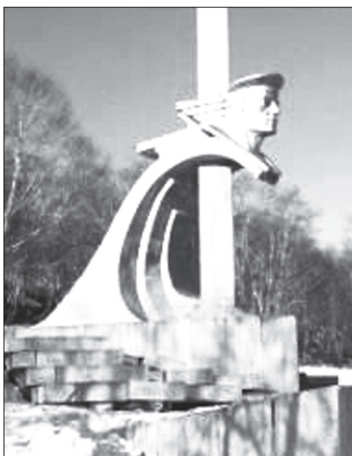
Мемориал памяти подводной лодки К-129.

Работы принимаются по адресу: г. Нижняя Тура, ул. 40 лет Октября, 2а (здание администрации), первый этаж, правое крыло, редакция газеты «Время». Электронный адрес: reporter@vremya-nt.ru . Желательно, чтобы к рассказу прилагалось фото героя.