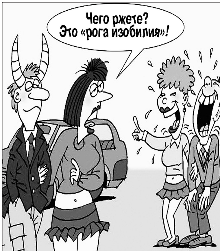
Иллюстрация с сайта http://caricatura.ru .