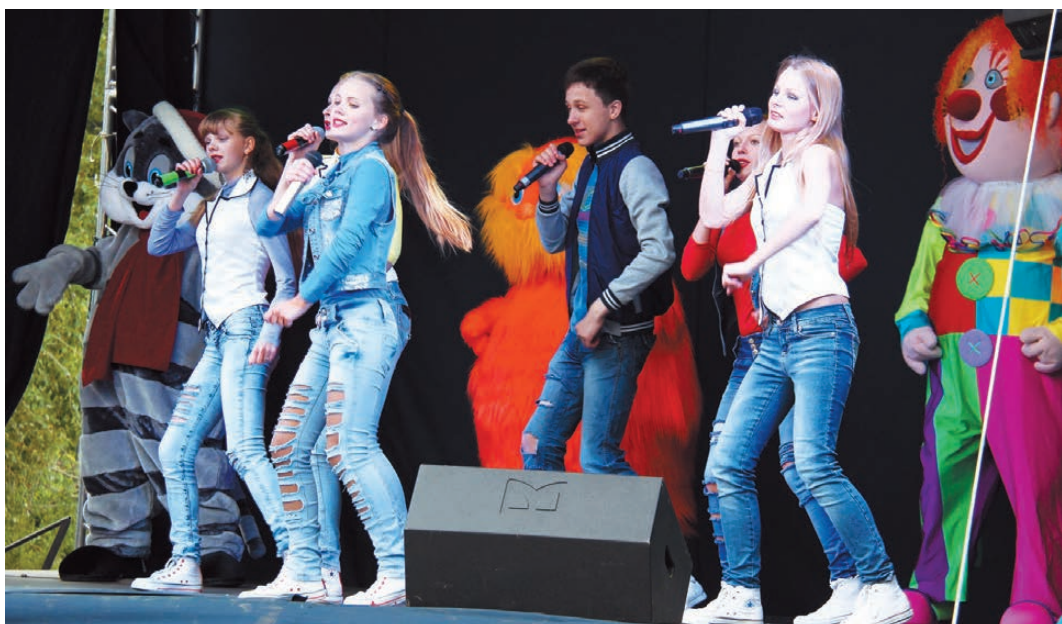
На сцене - творческие коллективы Дворца культуры.

Сергей ФЕДОРОВ. Окончание на стр. 3.