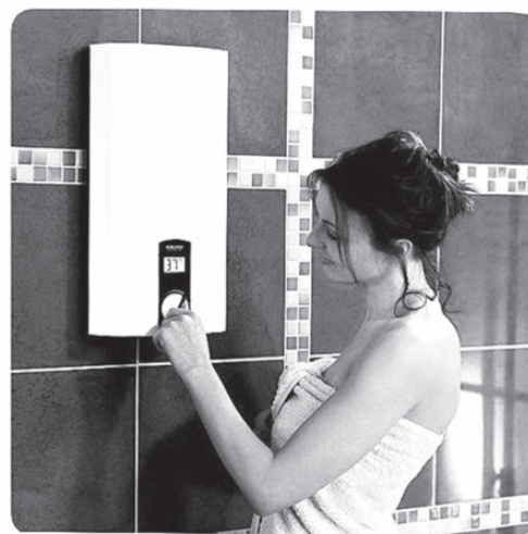
Водонагреватель поможет забыть о проблемах с горячей водой.

- Выбор водонагревателя по типу потребляемой энергии для покупателя в принципе несложен. А как сделать выбор между проточным и накопительным водонагревателями?