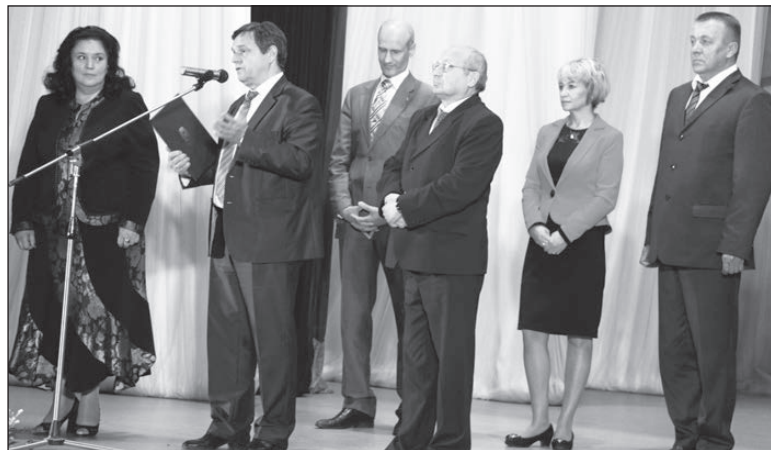
Глава округа Л.В. Тюкина (слева) принимает поздравления от глав соседних городов.

Более ста жителей Нижнетуринского городского округа награждены в честь юбилея города Почетными грамотами главы Нижнетуринского городского округа и городской Думы.