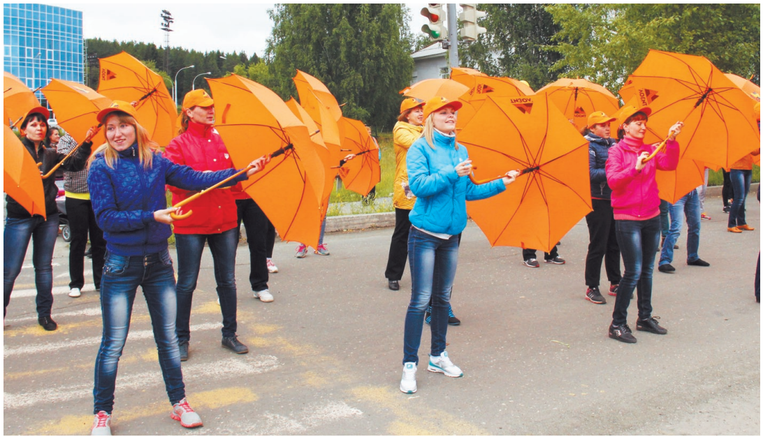
Танец с зонтиками в исполнении колонны ОАО «Тизол».

Соревнования проходили два дня. Было решено проводить игры по правилам пляжного волейбола (оказывается, при этом можно обойтись и без пляжа, достаточно лишь правильно оборудо-