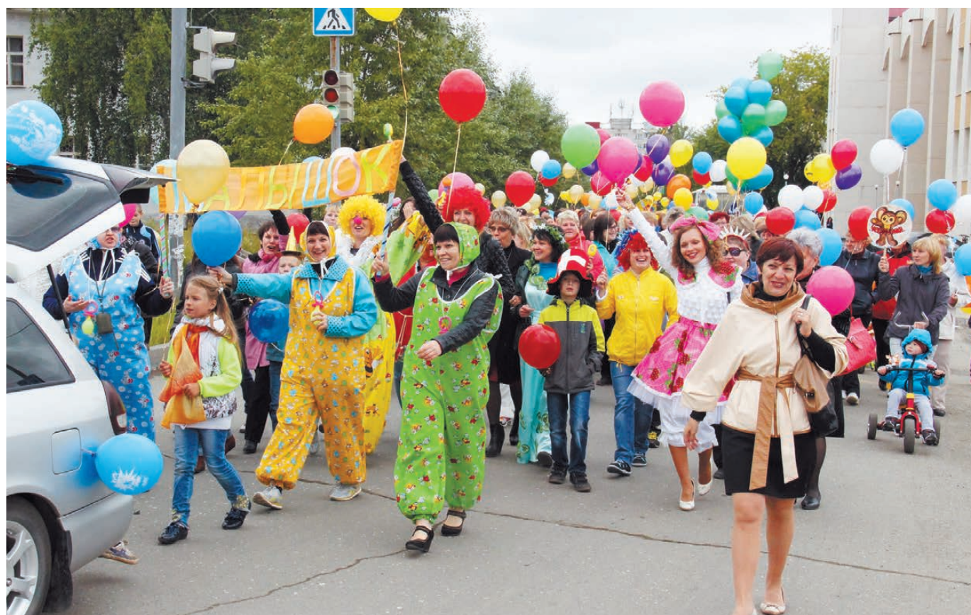
Сотни нижнетуринцев вышли на торжественное шествие по главной улице города.

Среди множества событий встречаются такие, которые остаются в нашей памяти на долгие годы. Новые знакомства, удачные приобретения, интересные открытия... У каждого из нас в самых сокровенных уголках души хранятся воспоминания о таких моментах жизни. Тем, кто окунулся в прошлую субботу в круговорот праздничных мероприятий,