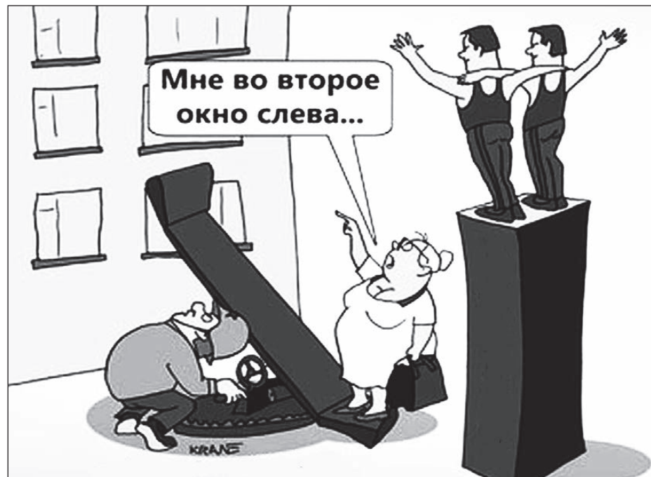
Карикатура с сайта kulichki.com

26 ИЮЛЯ город отметил день рождения. Юбилей прошел на высоком культурном уровне. Сценарий праздника, что приятно, учитывал все возраста участников, весело и интересно было и взрослым, и детям. А колокольный звон вызвал трепет у всех собравшихся возле строящегося православного храма во имя Трех Святителей.