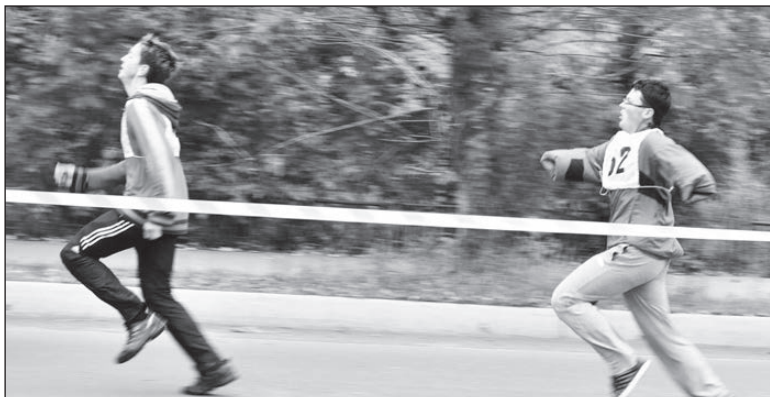
Один из любимых видов спорта у Максима — бег.

Наталья КОЛПАКОВА.