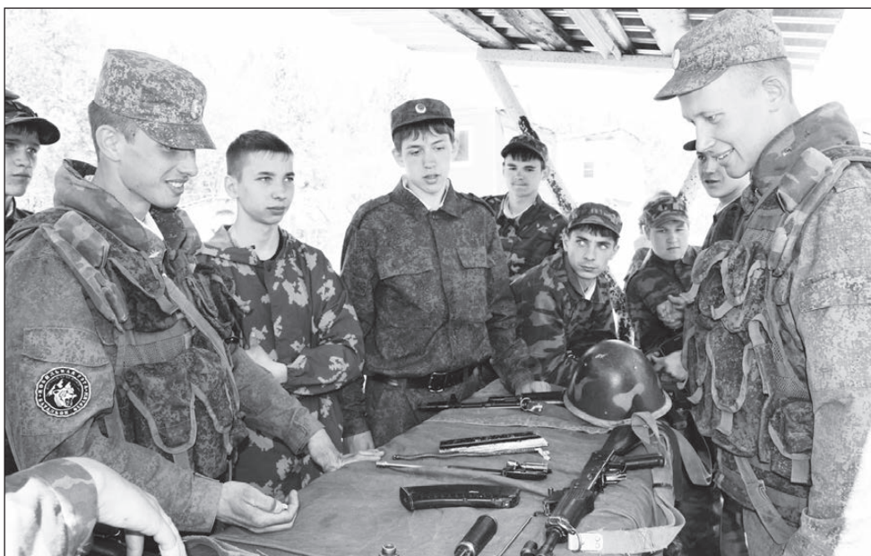
Разобрали автомат по «косточкам»