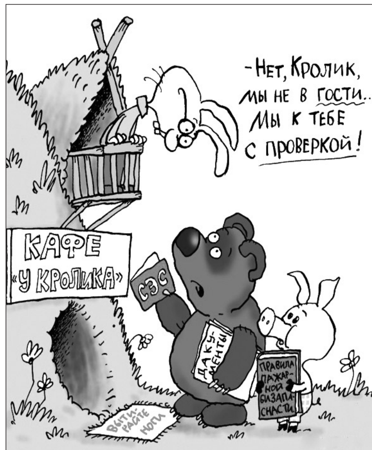
Иллюстрация с сайта http://caricatura.ru .