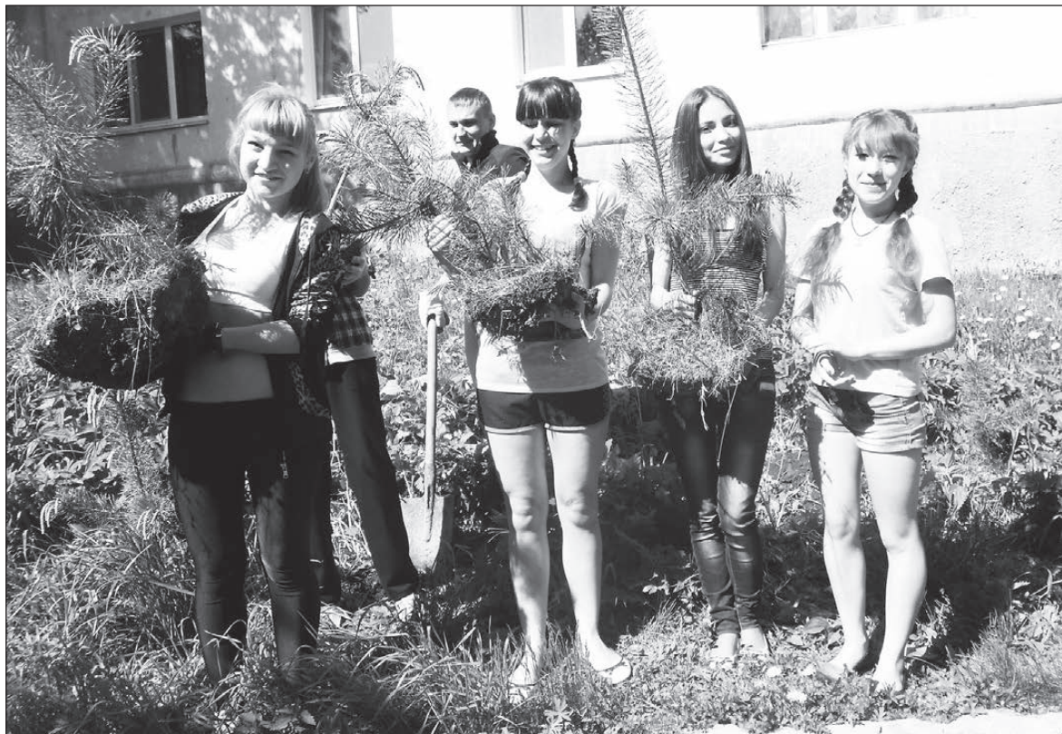
Еще 130 саженцев сосны было высажено на улицах Нижней Туры.

Воодушевившись успехом, год спустя молодые люди утроили усилия и посадили в разных районах города уже 130 молодых деревьев. Зеленые красавицы-сосны обосновались на пляже в старой части города (там трудился трудовой десант школы №1), напротив мемориала «Нижнетуринцам, погибшим в годы Великой Отечественной войны» (школа №7), рядом с домом №3 по ул. Машиностроителей (школа №3), а также рядом с домом №44 по ул. 40 лет Октября (школа №2).