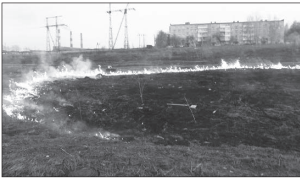
Каждую весну пустырь на ул. Скорынина превращается в пепелище.

МКУ «ОЖКХ, СиР» производит согласование разрешения на восстановление благоустройства территории после ремонтных работ. Согласно разрешению, Правилам содержания, обеспечения чистоты и благоустройства территории НТГО, благоустройство данной территории необходимо было выполнить до 13.06.2013 г. ООО «СТК» были выполнены работы по обратной засыпке траншеи. Планировка данного участка не произведена, поэтому за нарушение сроков восстановления благоустройства после проведения ремонтных работ на инженерных сетях ООО «СТК» направлен акт в административную комиссию Нижнетурунского