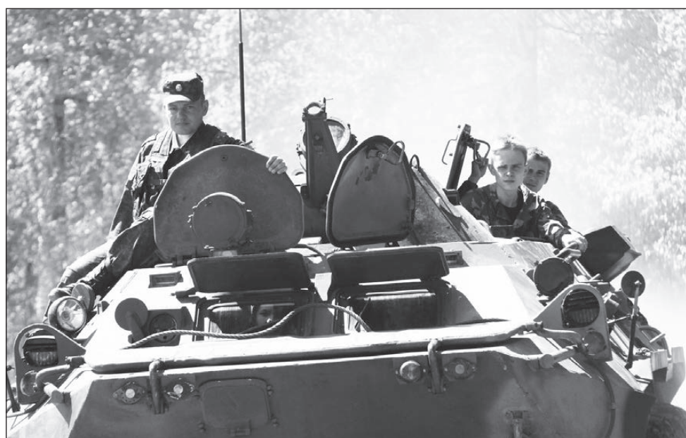
Проехать на БТРе с ветерком.

В ЧЕТВЕРТЫЙ день военно-спортивных сборов учащиеся десятых классов и ИГРТ выехали на стрельбы, проходящие на военном полигоне близ Лесного.