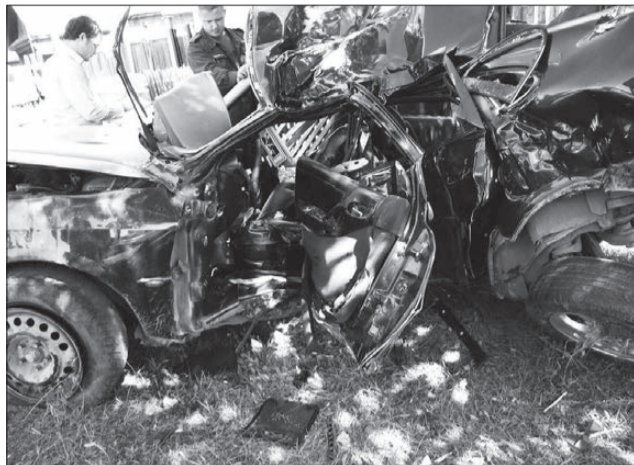
Скорость и алкоголь погубили водителя.

3 июля в 18.00 в поселке Федино водитель ИМЗ-8-103-10, двигаясь по улице Артема с превышением скорости — ехал он 70-80 км/ч, напротив дома № 180 не вписался в поворот, съехал с проезжей части, наехал на «километровый» столбик, потом — на водосточную трубу, мотоцикл перевернулся. Водитель погиб сразу, пассажир умер на 8-е сутки. Оба были в состоянии алкогольного опьянения.