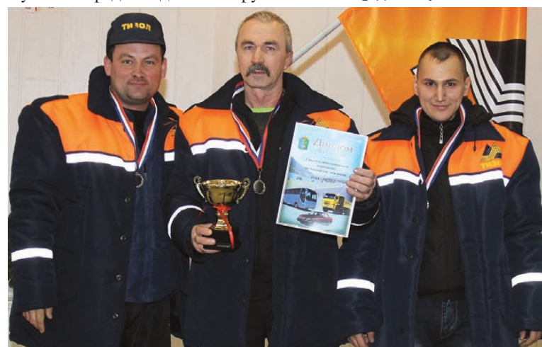
«Серебро» взяла команда ОАО «Тизол».