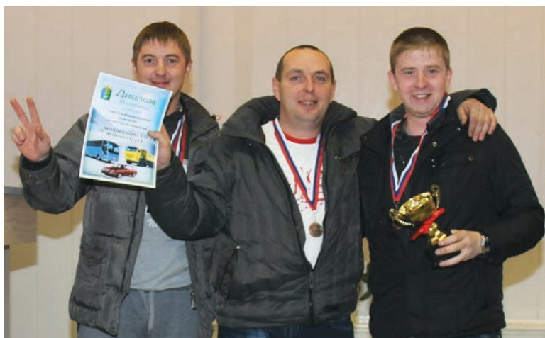
Бронзовый призер - команда а/к 14 ЮУТТист.

Фоторепортаж размещен на сайте http://vremya-nt.ru .