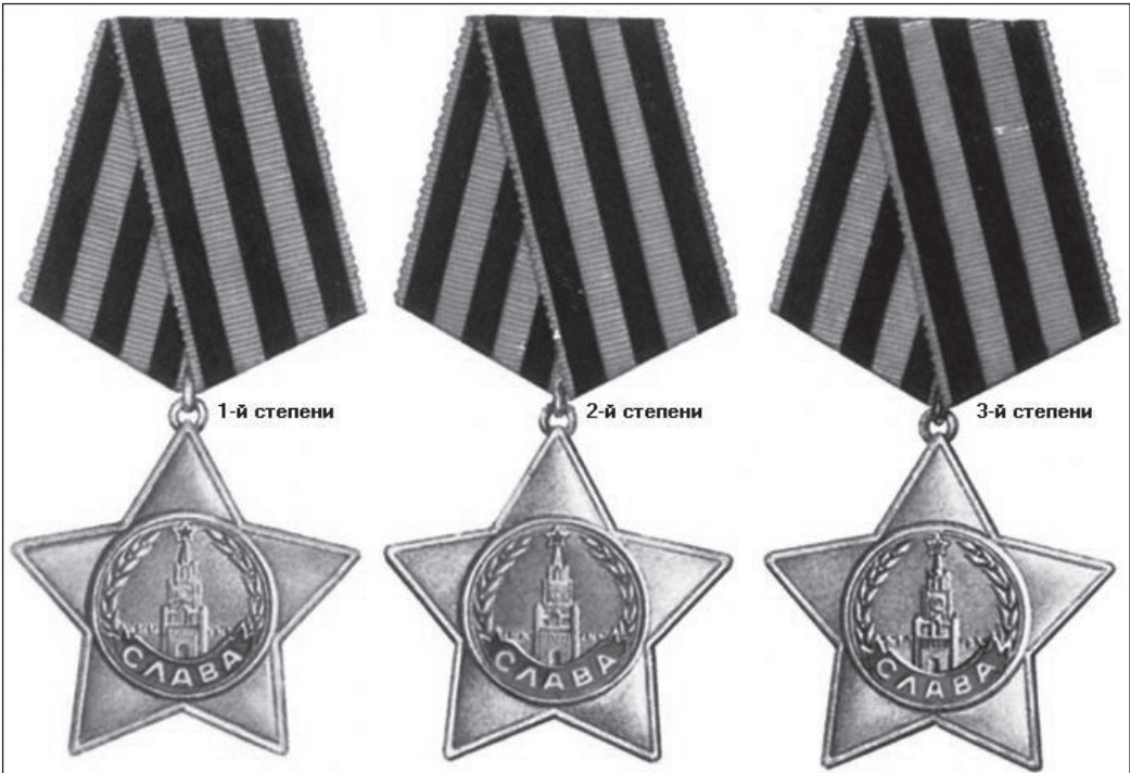
Знак ордена I степени изготовлен из золота. Знак ордена II степени - из серебра, а круг с изображением Кремля позолочен, орден III степени - серебряный.

По инф. Совета ветеранов. Из книги «Нижнетуринцы в боях за Родину».