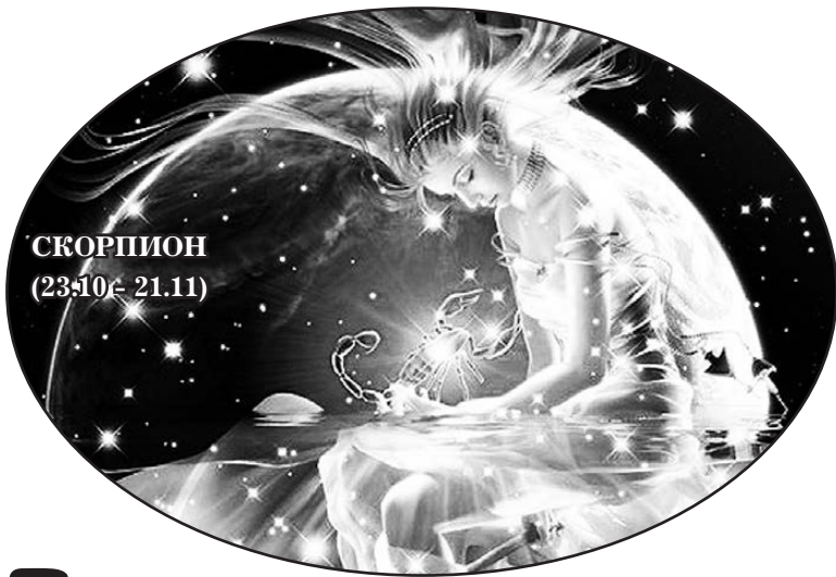
СКОРПИОН (23.10 - 21.11)