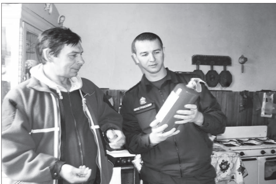
О правилах пользования средствами пожаротушения.

В отношении собственников жилья, нарушивших правила пожарной безопасности, возбуждены дела об административном правонарушении. Участники рейда напомнили жителям о мерах пожарной безопасности и как действовать в случае возгорания. Также проведены разъяснительные беседы о применении автономных пожарных извещателей и первичных средств пожаротушения и вручены памятки