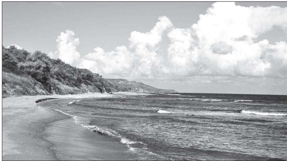
Поселок Кучугуры славится своим песчаным пляжем.

Фоторепортаж размещен на сайте http://vremya-nt.ru .