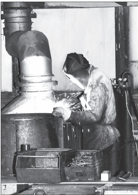
В одном из цехов ОАО «Вента».

Но все же главный положительный момент работы в прошедшем году - это сохранение