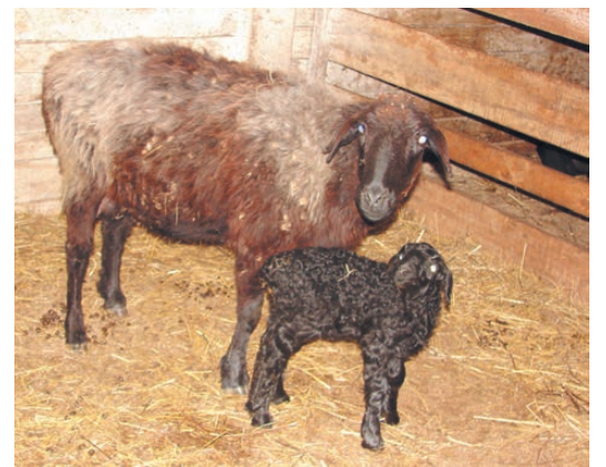
В мини-отаре пополнение.