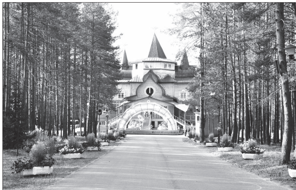
Дом главного волшебника страны открыт для гостей круглый год.

Покинув Великий Устюг, мы затопали ногами, требуя везти нас в более теплые края. Директор японской колесницы взял курс на Нижний Новгород. Только полюбоваться старорусскими красотоми нам не пришлось — зарядил дождь. Проскочив Арзамас, мы направились в сторону Краснодарского края. Полдня у нас заняла Ростовская область. Старательно