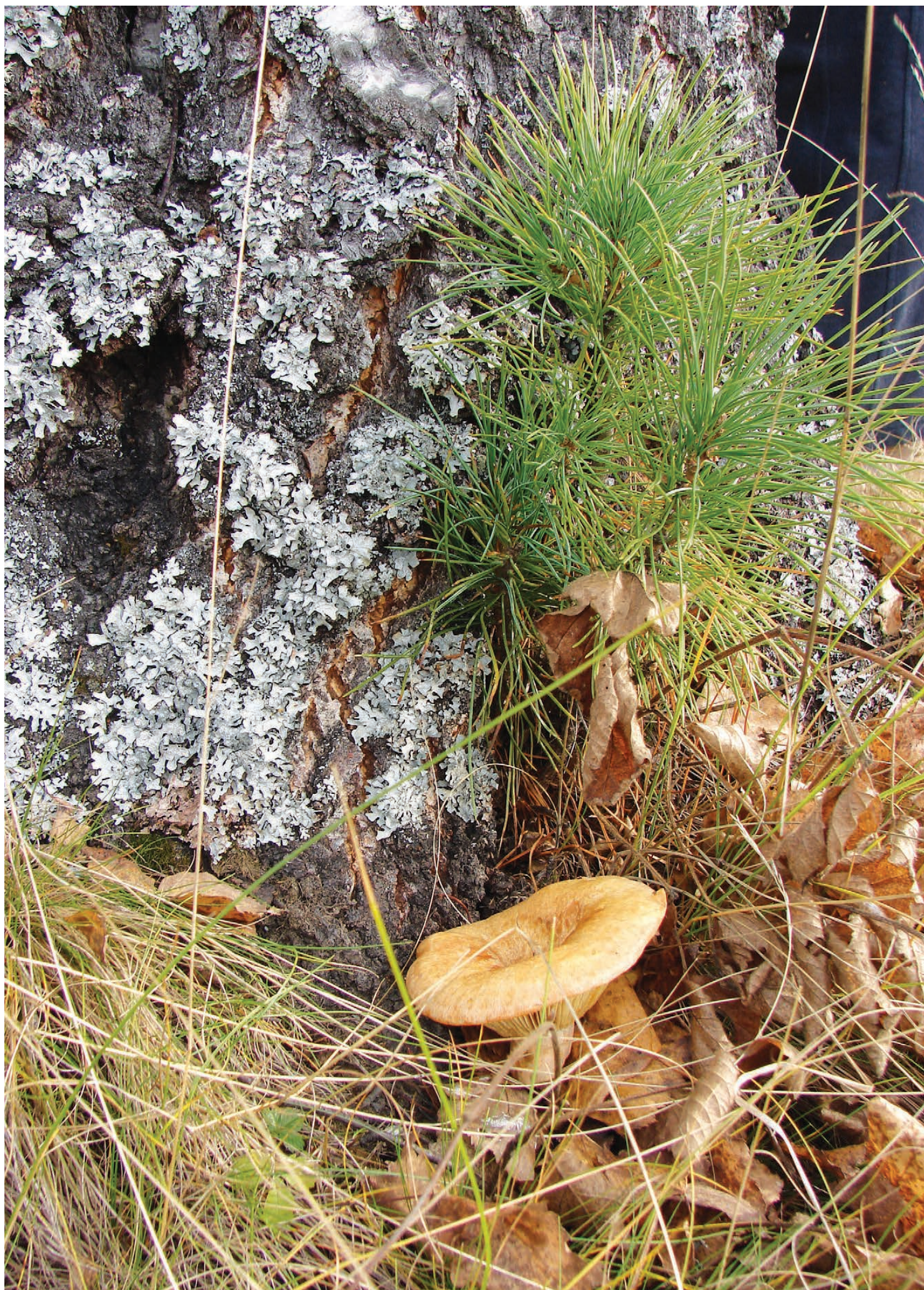
Рыжик - последний подарок осени.

ОКТАБРЬ. Всего лишь - октябрь. По жизни теплый, рыжий, бесшабашный. Говорят, любимый месяц греков. А еще — уральцев: овощные грядки уже порадовали спелостью плодов, дары полей и тайги перекочевали в закрома — лето было на удивление щедрым и на овощи, и на грибы-ягоды. Лишь птицы гомонят. «Прилетела птичья стая, тучи носятся, рыдая. Но поплакать — не примета: дарит месяц бабье лето».