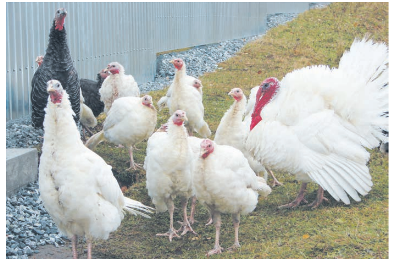
Грудь шаром, а хвост колесом.

По данным отдела экономики администрации НТГО, по состоянию на 1 июля поголовье основных видов скота в хозяйствах всех категорий Нижнетуринского городского округа составило: 252 коровы, из них 26 — в крестьянских хозяйствах, свиньи — 196, из