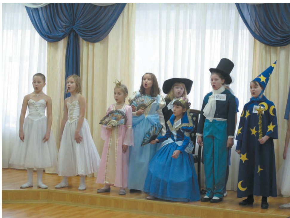
На сцене — музыкальная сказка учащихся хорового отделения ДШИ «Димин сон, или как исправить двойку по сольфеджио».

ежедневные концерты приглашенных артистов, экскурсии.