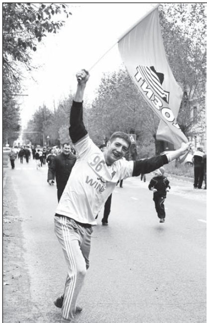
72 работника «Тизола» вышли на старт.