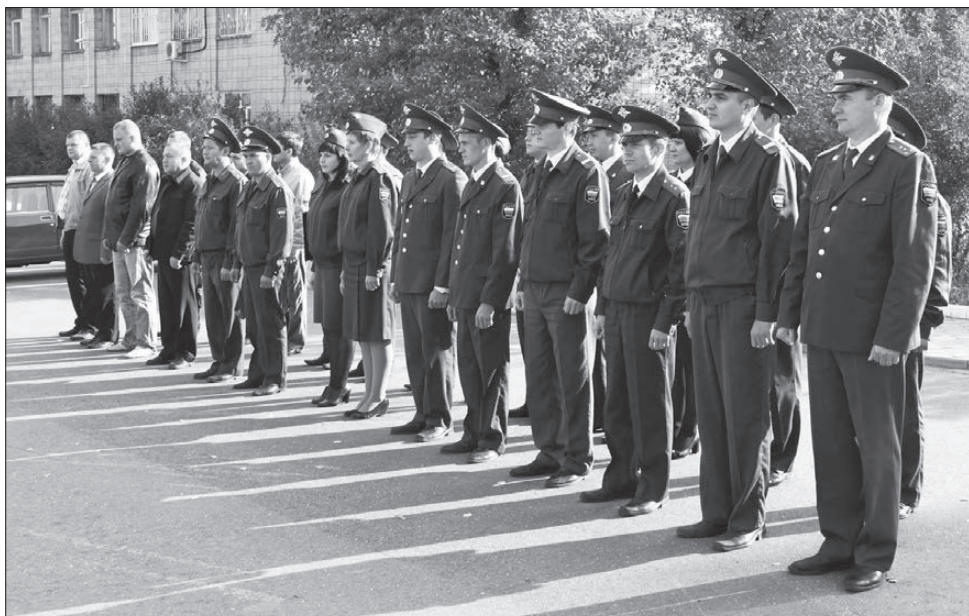
Сотрудникам ППС вручили почетные грамоты и благодарственные письма.

ния патрульно-постовой службы полиции №31 Межмуниципального отдела МВД России «Качканарский» собрались на городской площади для торжественного построения. Глава НТГО вручил почетные грамоты пятерым от-