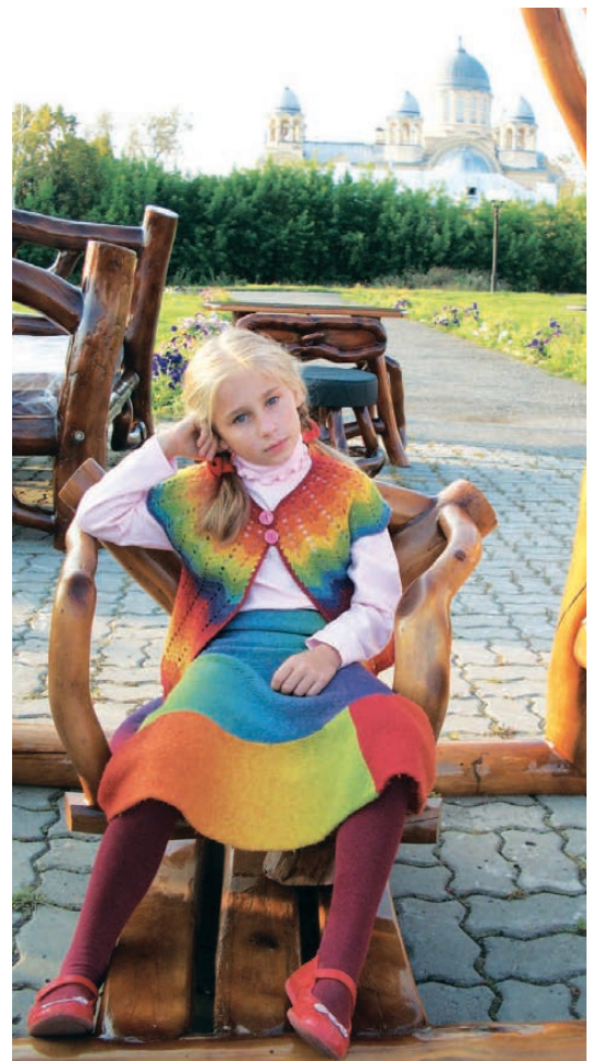
Вот для нее и надо возрождать духовность России.