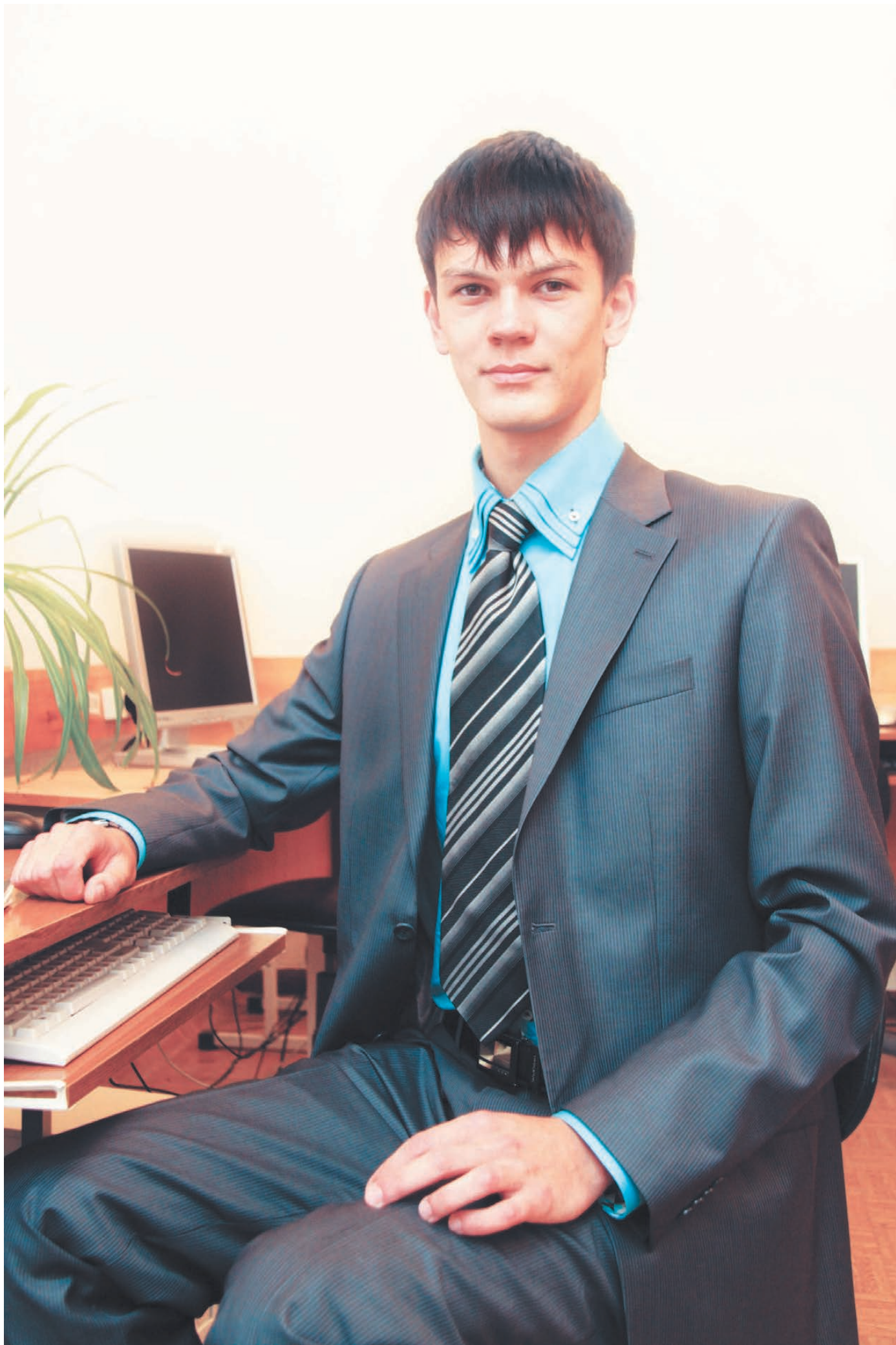
Павел Курочкин написал программу для «Газпрома».