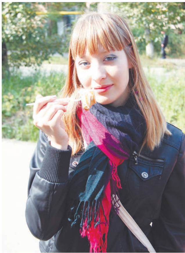
Юные выбирают «Эклеры».

От лимонного кекса на дегустационном столе не осталось ни кусочка. Всем понравилась его пикантная кислинка. Эклеры со взбитыми сливками также не за-