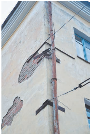
Дом № 6 по ул. 40 лет Октября. Растяжка вывортила несколько кирпичей.