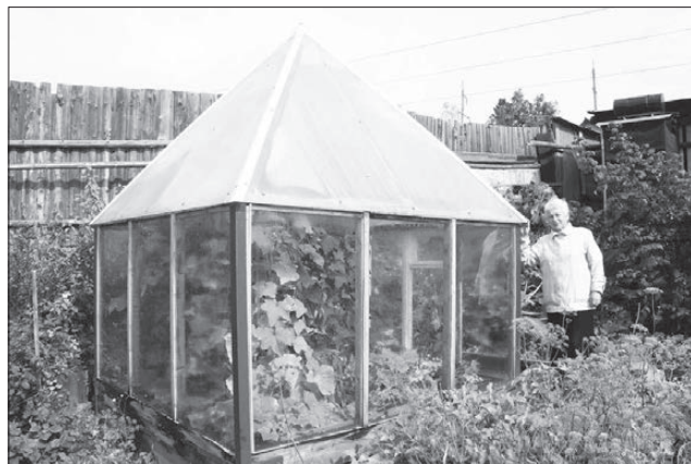
Вот такая садовая математика.

Хозяйка приписывает тепличке чудодейственные свойства, не отрицая влияние на урожай небесной энергии. Но при одном взгляде на ухоженный участок становится ясно, что здесь садоводы трудолюбивые, а у таких и без космических лучей урожай будет космических масштабов.