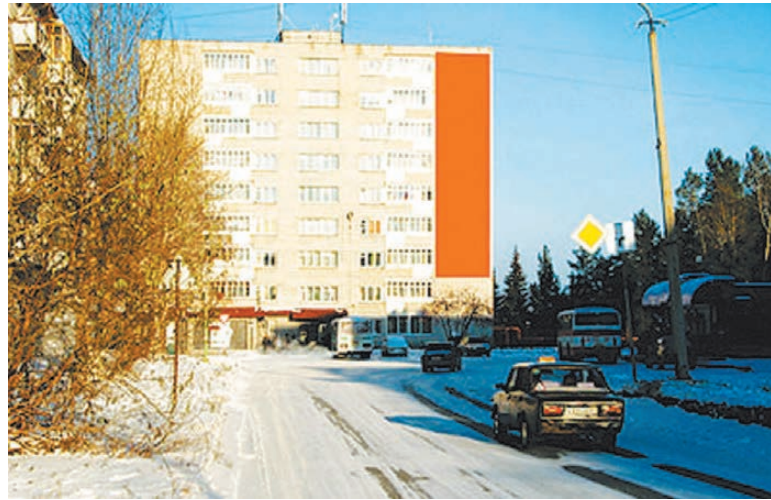
В «меню» — семь домов. Один — в муниципальной собственности.

Продолжая поиск «подводных камней», мы поинтере-