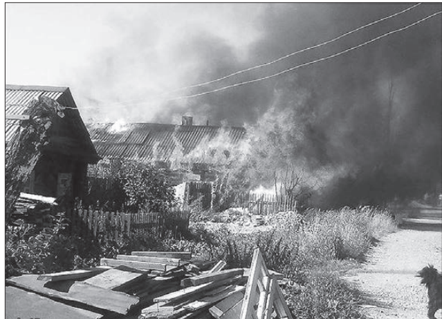
Дом-факел по ул. Красной привел очевидцев в ужас.

Давно это было, мы жили в поселке Косья. Многолюдно и весело в то время в Косье было, все трудились. И поселок хорошо выглядел: кругом чистота, везде тротуары, ухоженный сквер утопал в зелени, работал фонтан, который нас, ребятшек, очень радовал. От души веселились и дети, и родители на массовых гуляньях, часто проводимых в поселке.