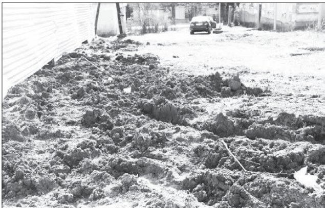
А пока обувь пешеходов принимает грязевые «ванны»...