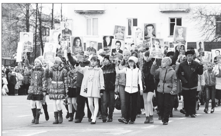
Участники акции «Вспомним героев» с фотографиями родных и близких.