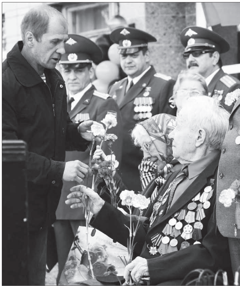
Благодарим за мирное небо!