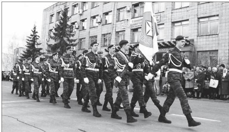
Военно-патриотический клуб «Алмаз».