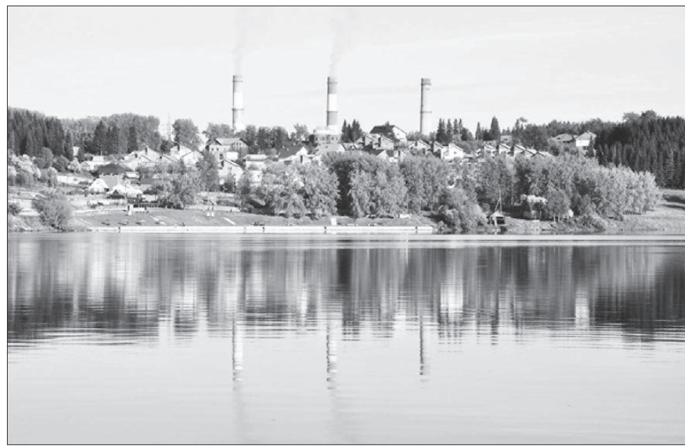
Как хороши окрестности Туры!

Отдельно хочется сказать об организованном нами военно-патриотическом маршруте для школьников, позволяющем сердцем прикоснуться к городским реликвиям и их истории: мемориалу, возведенному в честь погибших в годы Великой Отечественной войны, памятнику жертвам современных локальных войн «Черный тюльпан». Рассказ бывшего директора завода