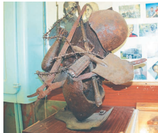
Экспозиция «Что пришлось на долю солдата Великой Отечественной».