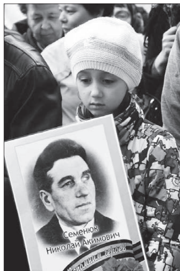
Будем помнить героев!