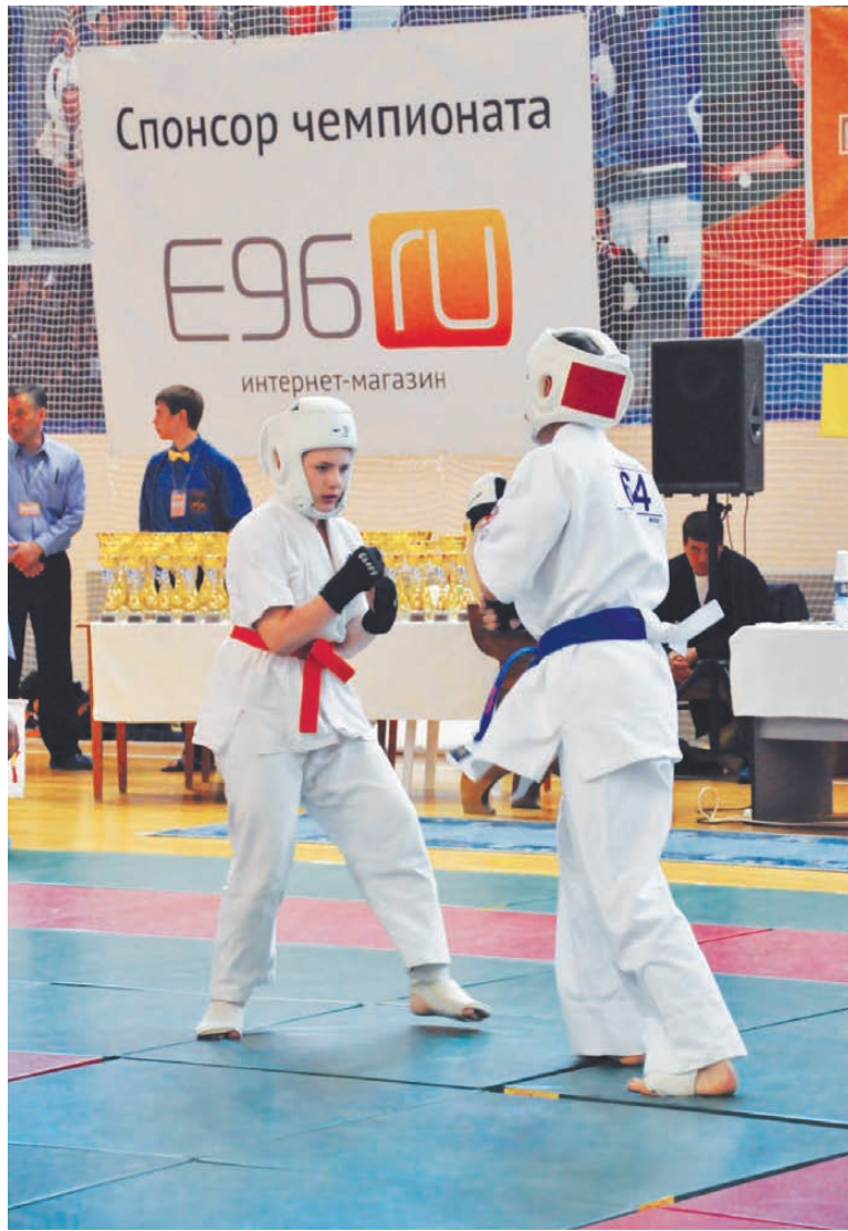
На первенство по кумитэ Кекусин карате в Нижнюю Туру приехали более 150 каратистов.

В споре юношей в возрасте 12-13 лет (до 39 кг) лучшим стал Е. Третников. В весе до