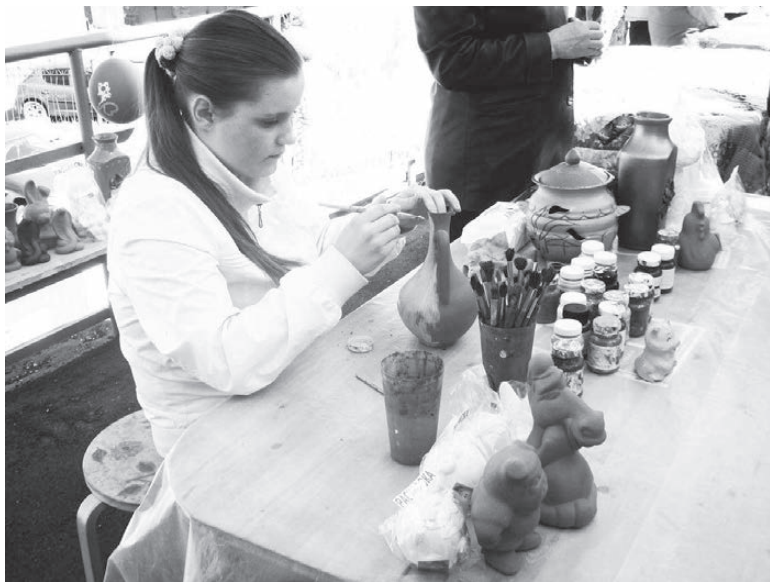
Приглашаем к творчеству.

ВОСКРЕСНЫЙ день 12 мая был солнечным, но довольно прохладным и ветреным.