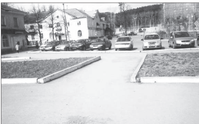
«Клумбы можно потеснить».

ВОЗЛЕ Детской школы искусств есть небольшая площадка для парковки машин. Рядом разбиты клумбы, цветы радуют глаз до поздней осени. Красиво, не спорю, но лично меня больше волнует практическая сторона вопроса. Стоянка очень маленькая, тем более для этого, центрального, района, единственный способ ее расширить - убрать клумбы. Точнее, не убирать, а разбить их в другом месте, где-нибудь поблизости.