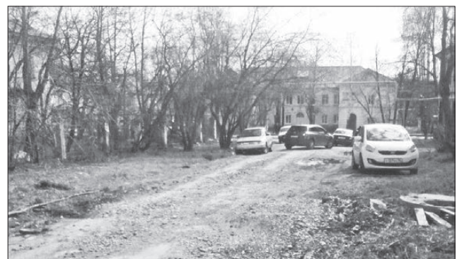
«Деревья, как сейчас? Или приличная парковка, как хотелось бы?»