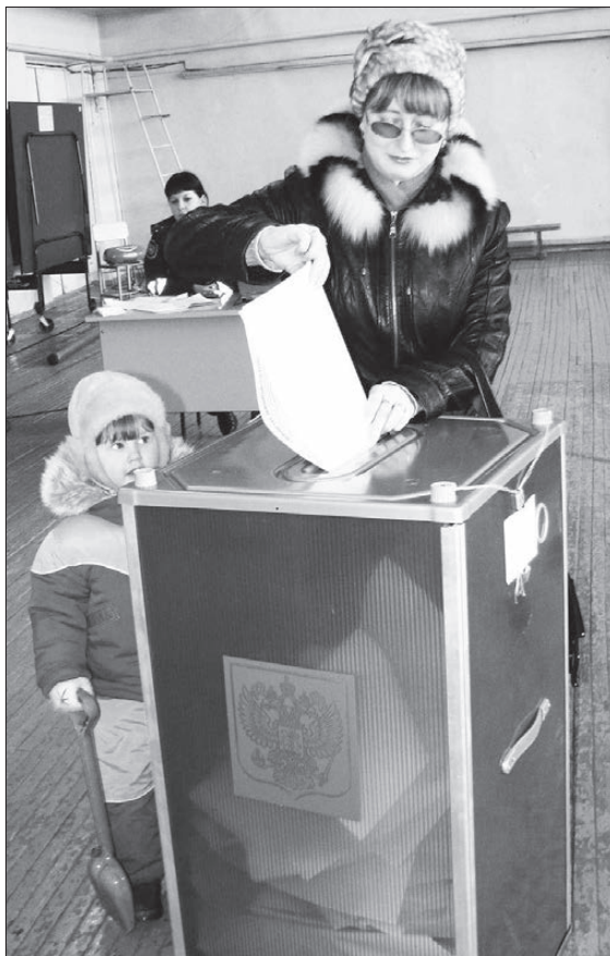
Ближайшие выборы - в декабре этого года.

Теперь выборы единого органа государственной власти субъектов РФ будут раз пять лет