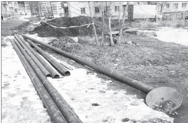
Бесхозные железяки ждут хозяина.