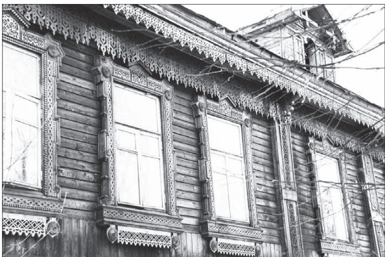
Особняка купеческой династии Задворных уже нет.

18 апреля — Международный день памятников и исторических мест