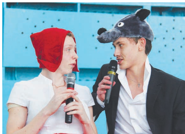
«Криминальная» парочка: Красная шапка и волк.