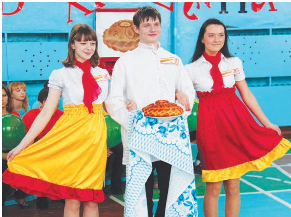
С хлебом-солью - «Высший сорт».

«Высший сорт» предложили залу посмотреть новую постановку «Красной шапочки», в которой юная обладательница броского головного убора пошла по узкой дорожке, превратив сказку в криминальное чтиво, но ко- нец истории, несмотря