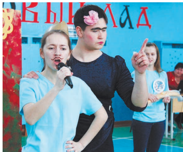
Принцессу - в жены за лаваш.