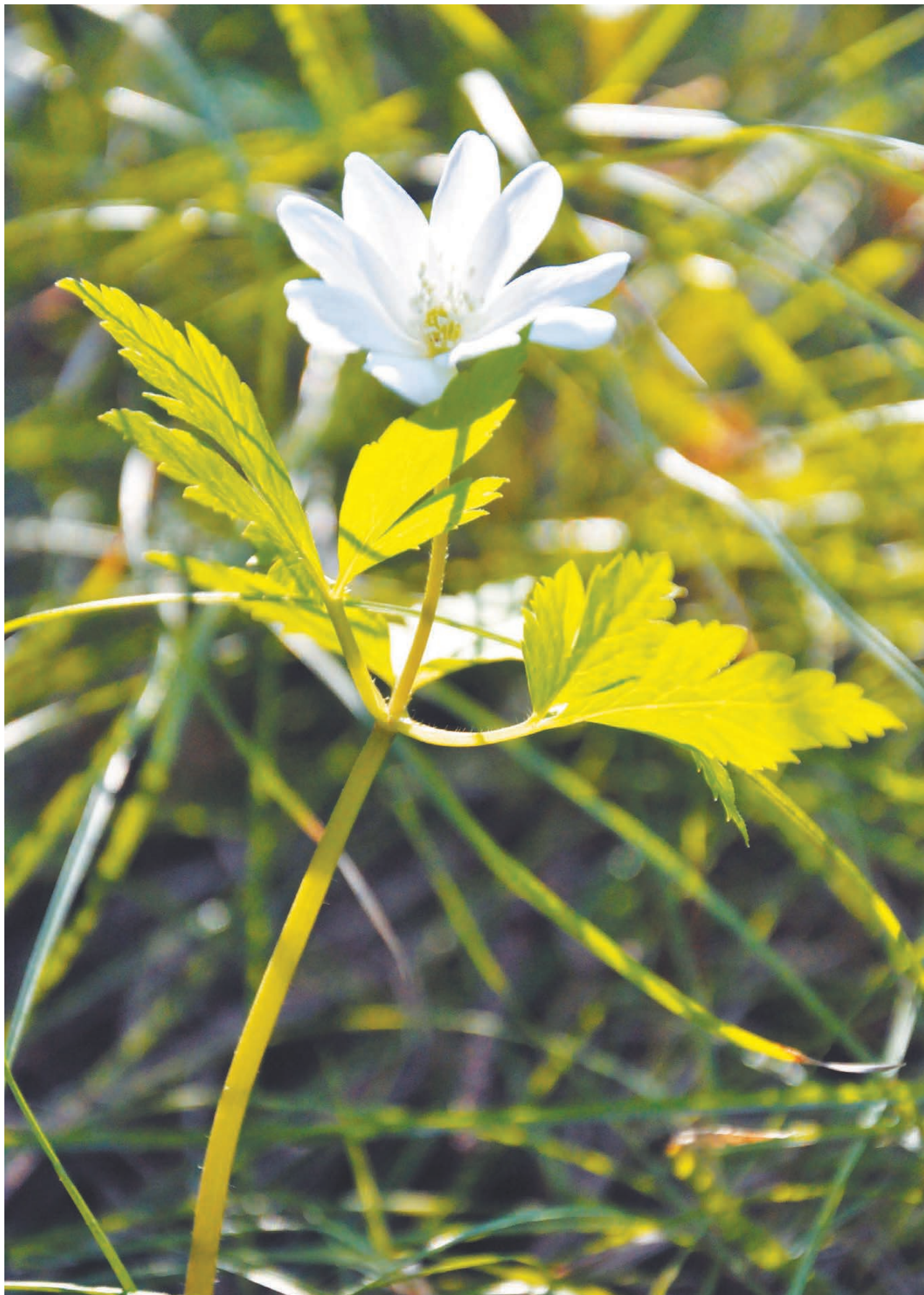
И у подснежника есть Международный день: 19 апреля.

Подготовила к печати Наталья КОЛПАКОВА.