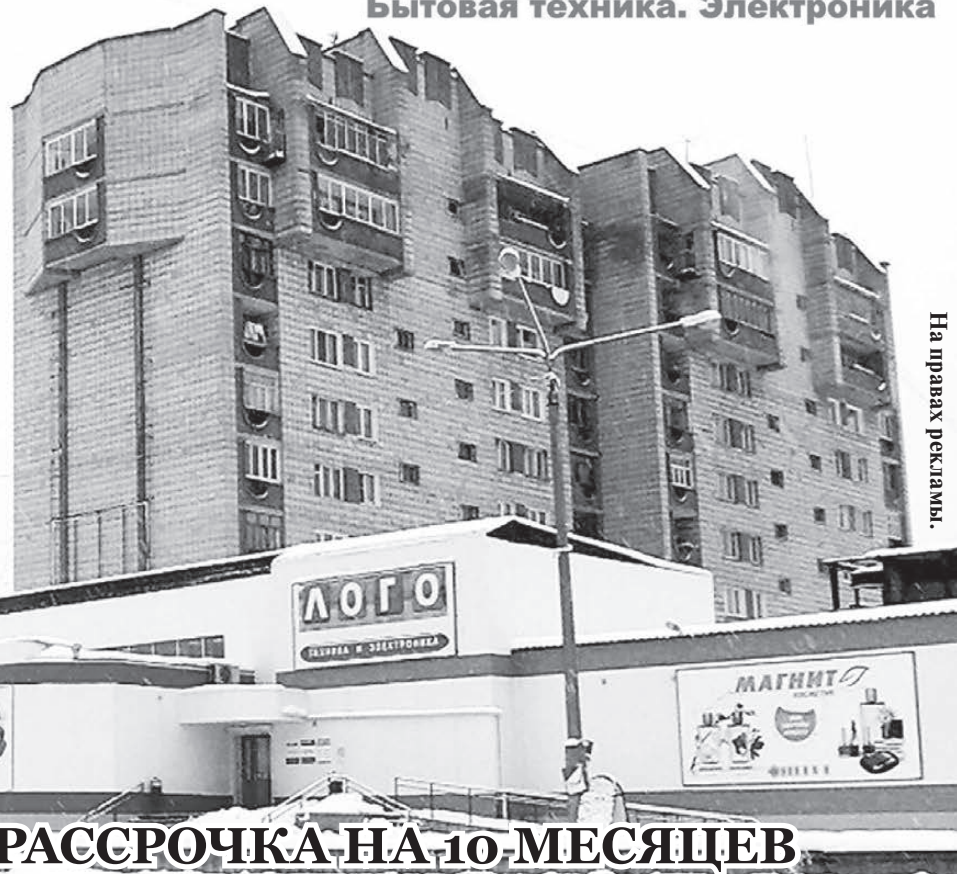
На правах рекламы.