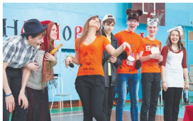
«Колобок» от «Кексиков».