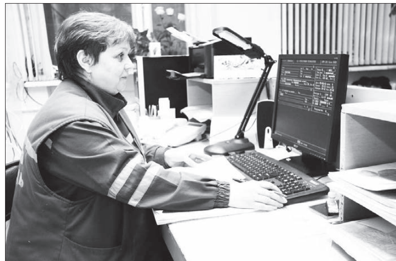
Работу скорой помощи контролирует компьютер.