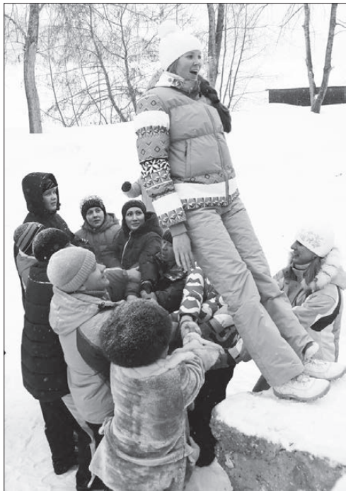
Ловите меня, друзья!

В ЭТОМ году нижнетуринцам предстоит принять участие сразу в двух избирательных кампаниях. Совсем скоро, в конце марта, состоятся дополнительные выборы депутата Законодательного Собрания Свердловской области. А осенью нам предстоит решить, кто будет руководить Нижнетуринским городским округом следующие пять лет.