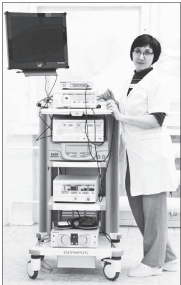
На помощь врачам пришла электроника.