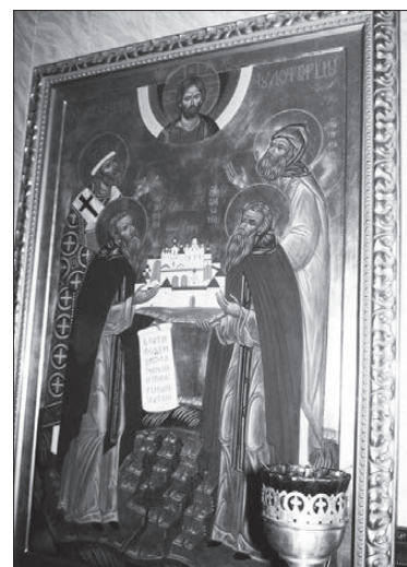
Иконы — самая большая ценность прихода.

— Вы знаете, я никак не могу согласиться с тем, что наши чиновники стали вдруг воспринимать храмы частью своих социальных учреждений, поскольку тут всегда накормят, обуют, обогреют. Да, это так. Но это было во все времена, еще до появления социальных служб в городских муниципалитетах. Но при этом