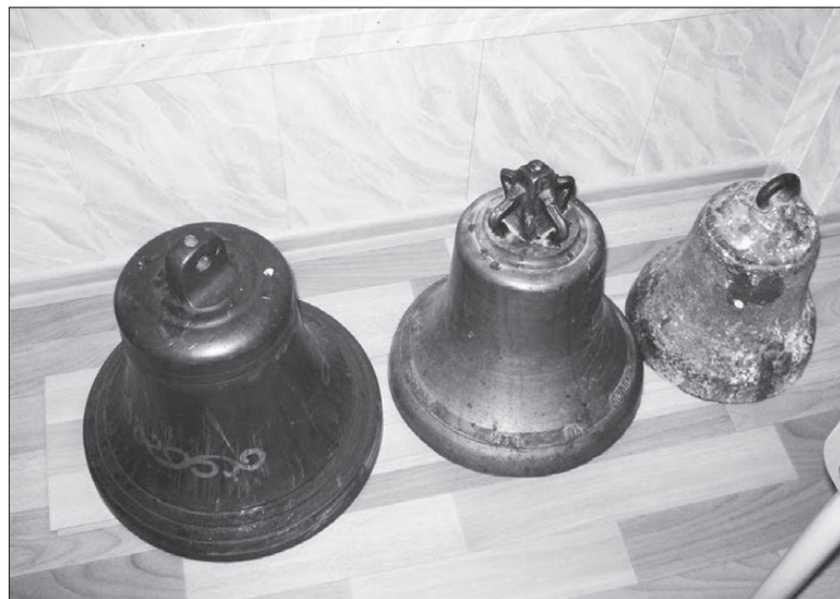
Колокола для звонницы подарили железнодорожники.

ховные принципы и ценности, которые закладывались тысячелетиями в нашем государстве, обществе. Вот вам и спиленные кресты, и разбитые иконы, и пляски в Храме Христа Спасителя, месте, откуда во время литургии как раз и открывается тот самый портал связи человека и Бога, дается мудрость и терпение человеку, приходит помощь. Все ведь более глубинно, чем мы себе представляем.