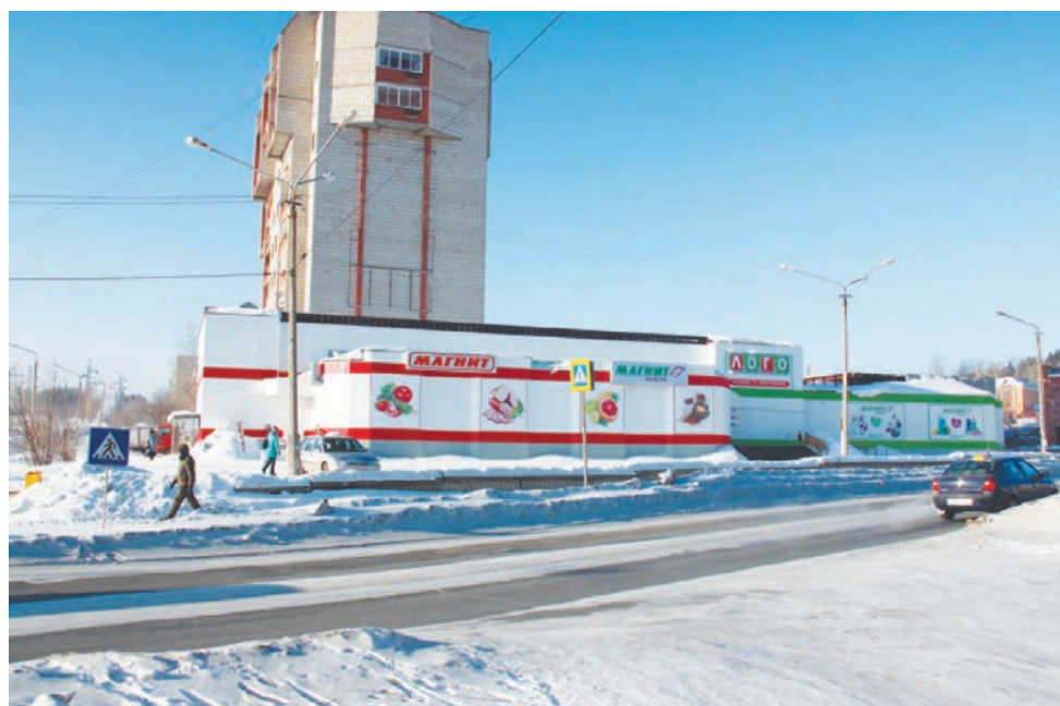
«ЛОГО» «поселился» на ул. 40 лет Октября, 10а.

ЧТО подарить любимой на 8 Марта? Ответ на этот вопрос можно найти в техномаркете «ЛОГО», который основательно пополнил ассортимент товаров, чтобы ваши весенние подарки получились отличными. На полках популярного в народе маркета покупателей ждут СВЧ-печи, пылесосы, кухонные комбайны, блендеры, фены, утюги и парогенераторы, чайники, кофеварки и соковыжималки. В торговом зале дружными рядами выстроились холодильники, многофункциональные стиральные машины, суперсовременные LED телевизоры.