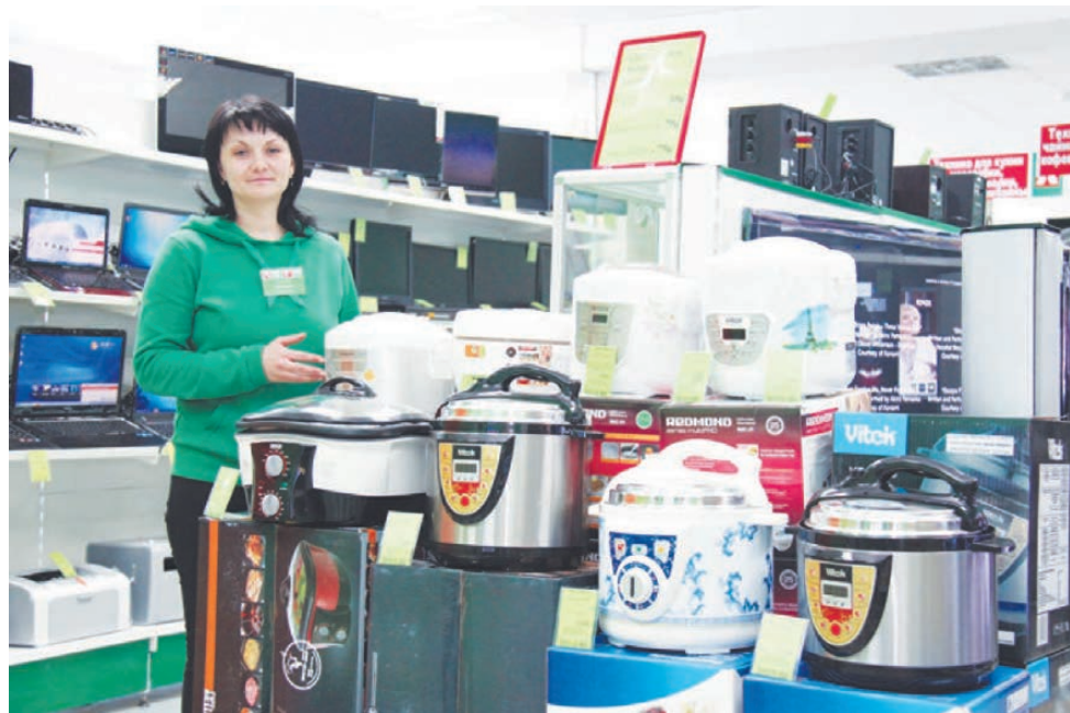
Спасет от плиты мультиварка.