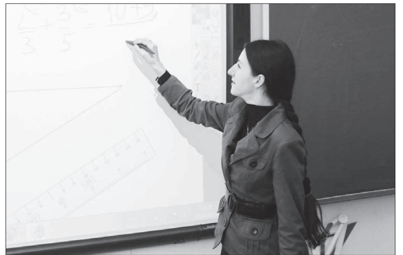
Работать с интерактивной доской одно удовольствие.

В конце прошлого года в одном из интервью начальник Управления образования Нижнетуринского городского округа отметил, что наш округ выполнил задачу Министерства образования