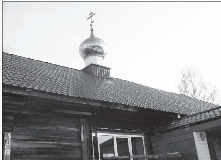
«Купола в России кроют чистым золотом, чтобы чаще Господь замечал...»

Отцы пустынноики и жены непорочны, Чтоб сердцем возлетать во области заочны, Чтоб укреплять его среди дольных бурь и битв, Сложили множество божественных молитв ... А.С.Пушкин.