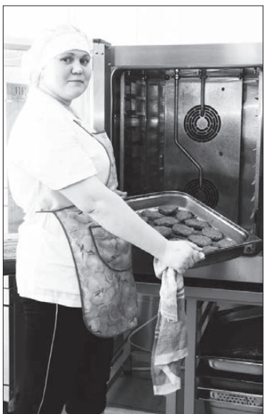
Здоровая пища из пароконвектомата.