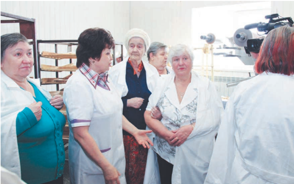
Все изменилось - только в лучшую сторону.