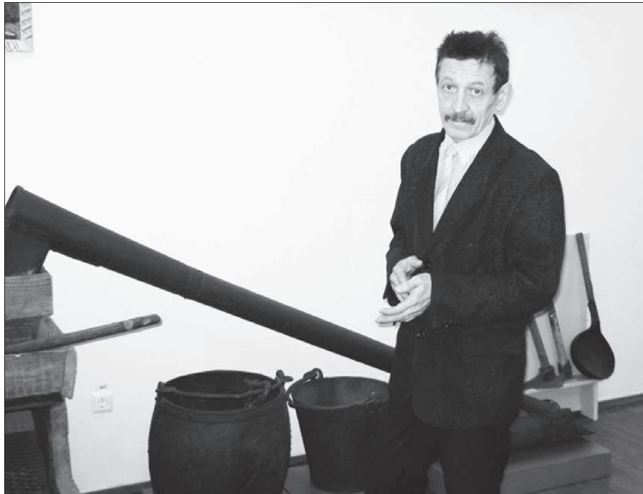
Теперь музей - Филиал Невьянского государственного историко-архитектурного музея.

- Несомненно. Установление советской власти, подъем народного хозяйства, разработка приисков, дражный флот, введение гидравлики (после приезда в наши края Орджоникидзе), необычайный взлет трудовой активнос-