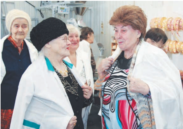
Приятно вновь пройти по цехам.