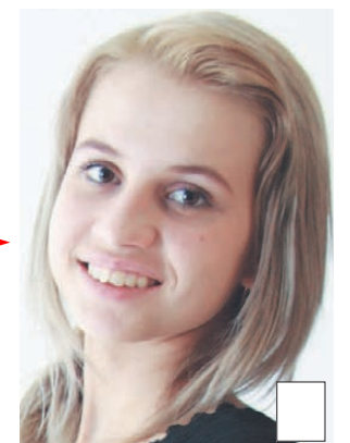
Подготовил Сергей ФЕДОРОВ.

Для нее конкурс — это возможность проверить свои способности. Ее девиз: «Верь в себя, и мечты сбываются!»