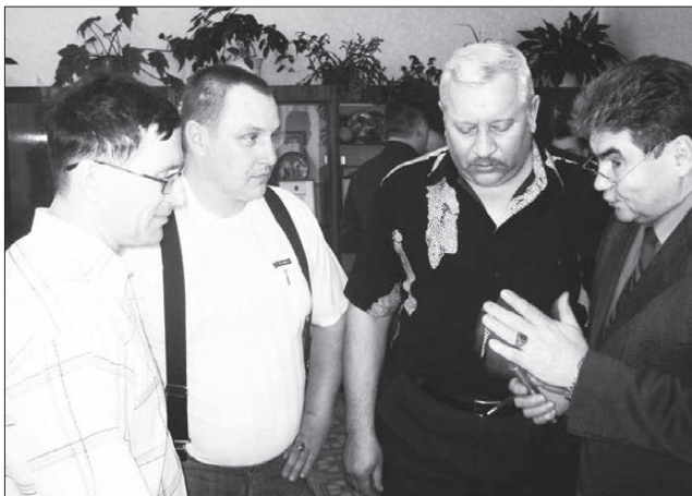
Порядка душа требует.

Девять исовчан стали народными дружинниками