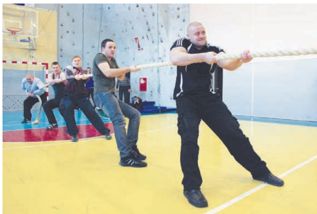
Сумели удержать канат.

Фоторепортаж размещен на сайте http://vremya-nt.ru .