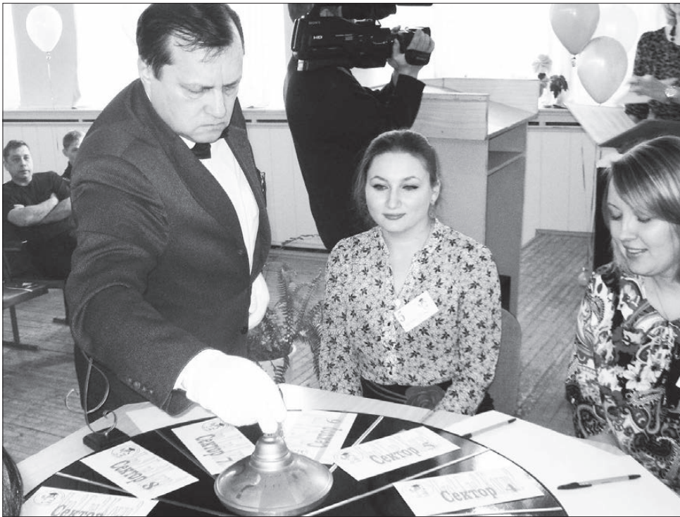
Настоящий волчок раскручивал настоящий крупье.

КАЖДОЕ третье воскресенье февраля вновь наступившего года считается, по постановлению Центральной избирательной комиссии России 2007 года, Днем молодого избирателя. Вот уже седьмой раз подряд Нижнетуринской избирательной комиссии среди школьников, студентов, членов избиркомов проводятся в этот день самые различные мероприятия, направленные на правовое просвещение молодежи в области избирательного права.