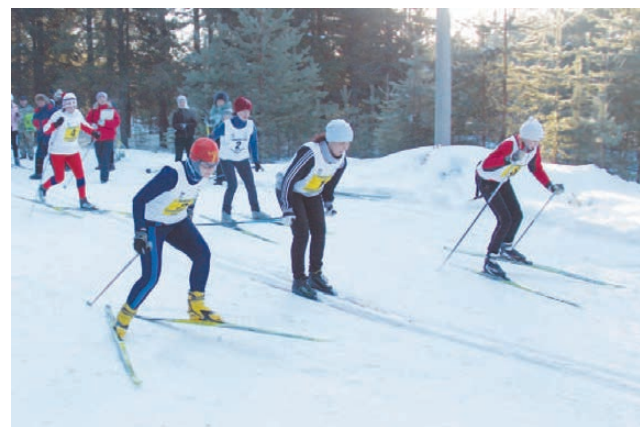
На старте лыжной эстафеты.