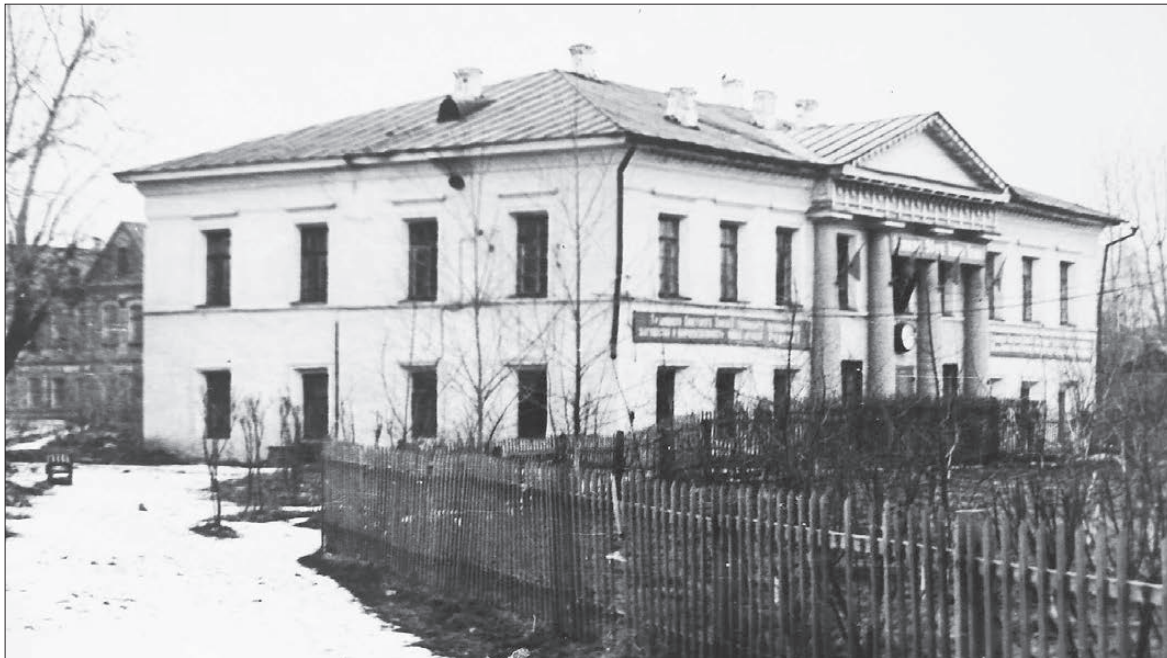
авоудуправление электроаппаратного завода. Архивное фото.