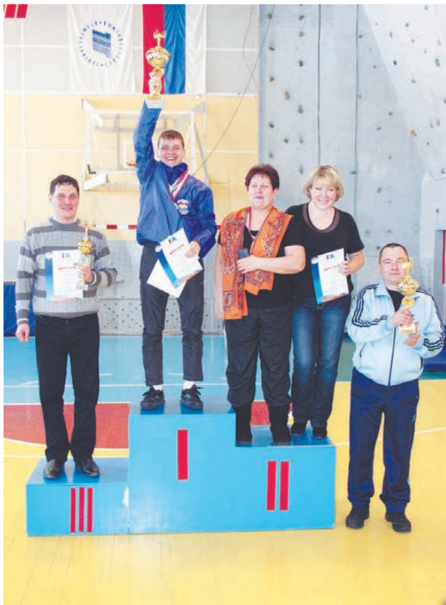
Нижнетурунцы победили с внушительным отрывом.

ЧТОБЫ заниматься спортом, исовчанам достаточно сделать всего один шаг. Прямо на въезде в поселок Ис расположен целый комплекс спортивных сооружений. Освещаемая лыжная трасса, зал для настольного тенниса, хоккейный корт, футбольные поля, спортзал со скалодромом... Олимпийская деревня в миниатюре. И когда перед нижнету-