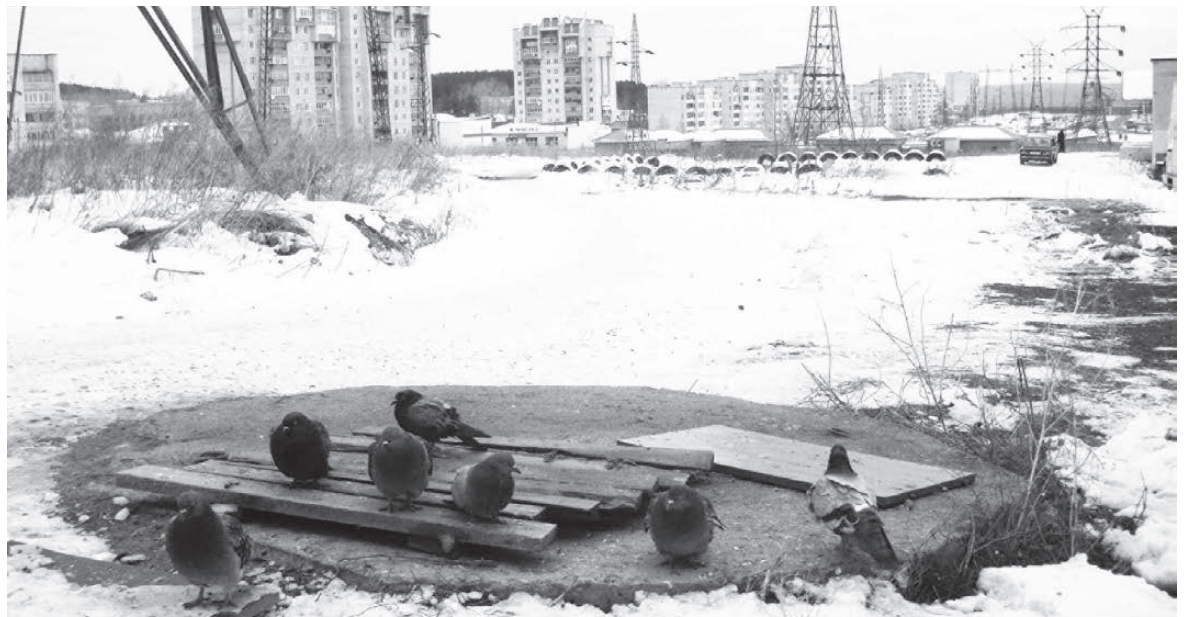
В «СТК» пообещали, что колодец накроют, как положено.