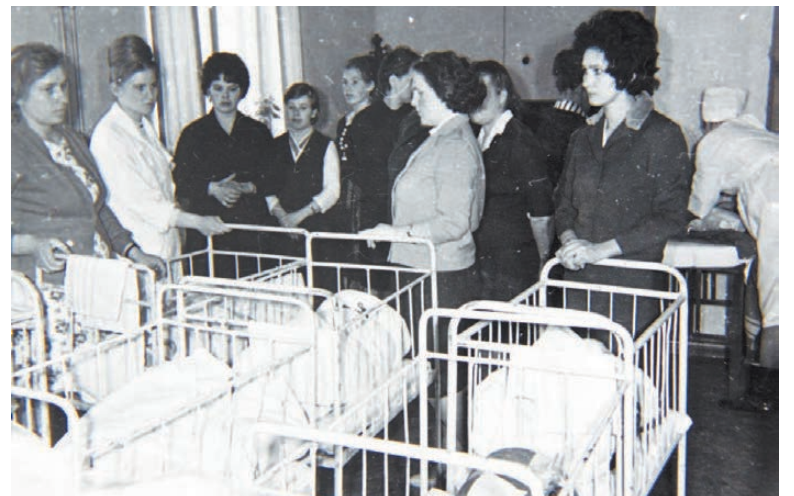
Перед торжеством в ДК юные граждане могли поспать.