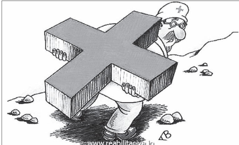
Тяжело приходится бесплатной медицине...

На втором этаже меня ждала картина не лучше. Коридор был буквально набит людьми — молодыми и пожилыми. Особенно печальна оказалась ситуация со стариком, который просидел 5 часов, ожидая приема. Плохоходящий, с