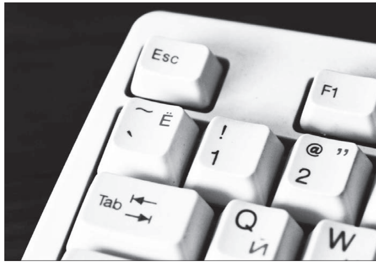
Буква «Ё» на клавиатуре есть! В левом верхнем углу.

Интересно, что буква «Ё» была введена в азбуку в ноябре 1783 года, когда общее собрание Петербургской Академии наук утвердило предложение её директора княгини Дашковой о замене сочетания «ю» на новую букву «ё». В декабре 1942 года приказом народного комиссара просвещения РСФСР было введено обязательное употребление буквы «Ё» в школьной практике. Насколько известно, этого приказа никто не отменял. 228 лет назад буква встала в алфавит под магическим, седьмым, номером. Может быть, поэтому с ней до сих пор происходят удивительные вещи? Почему-то при оформлении самых разных документов редкие буквы в паспортных данных становятся непреодолимым барьером. По неведомой простому гражданину причине чиновники не всегда верят справкам из кадровых служб и бухгалтерий, утверждающих, что в разных документах указан один и тот же человек и его персональные данные везде идентичны. Хотя юристы утверждают, что во всем виноваты не чиновники, а казуистика. Где ещё (кроме России) есть буква, обязательная в книгах для де-