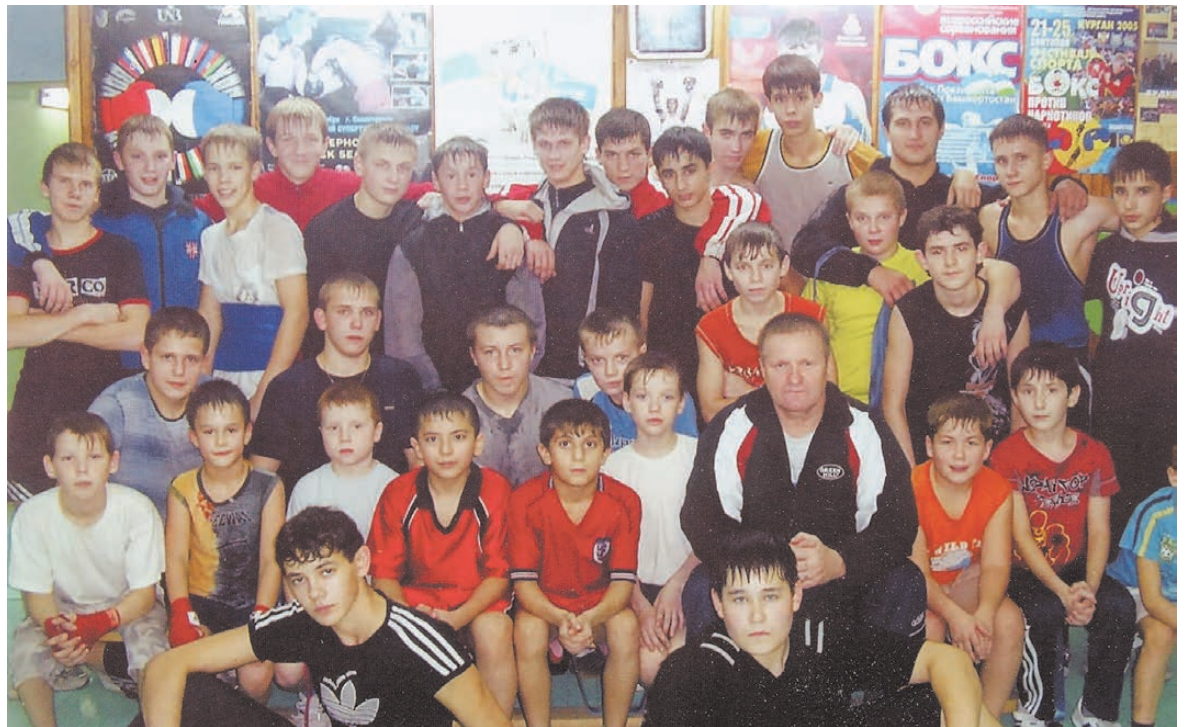
Тридцать три богатыря.

- Все эмоции ребята обычно растрачивают на ринге. И если у боксера после боя остается негатив к сопернику, значит он выложился в поединке не до конца, поберег силы, а с ними оставил и негативные эмоции.