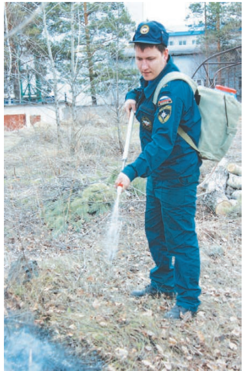
Пожарные тушили траву уже 6 раз.

Как правило, лесные пожары — затяжные. Ветер разносит пламя, а бороться с огнем пожарные могут только в светлое время суток — дым, падающие деревья — огромная угроза. Впрочем, как и горящие торфяники. Подземный пожар коварен тем, что никак себя внешне не выдает, и в горящую землю можно провалиться. Но у нас, к счастью, торфяников нет. Зато есть Шайтан, который исправно горит каждый год. Причина пожаров — снова человеческая безалаберность. На скалистой местности небольшой почвенный слой, деревья кое-как «цепляются» за землю корнями, поэтому для Шайтана губителен даже низовой пожар. В прошлом году деревья падали, создавая условия для более серьезных