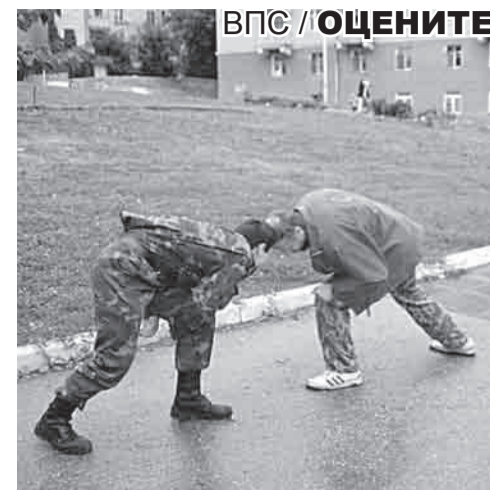
ВПС // ОЦЕНИТЕ