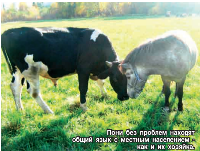
Пони без проблем находят общий язык с местным населением - как и их хозяйка.