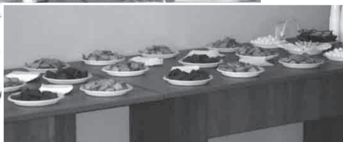
Задобрить участников семинара «статусный» Артюх и Ко пытались с помощью печенек.