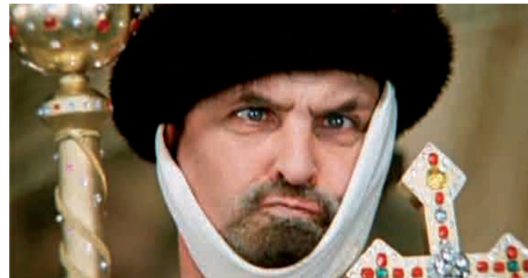
Похоже, что городская власть нуждается в психиатрическом освидетельствовании