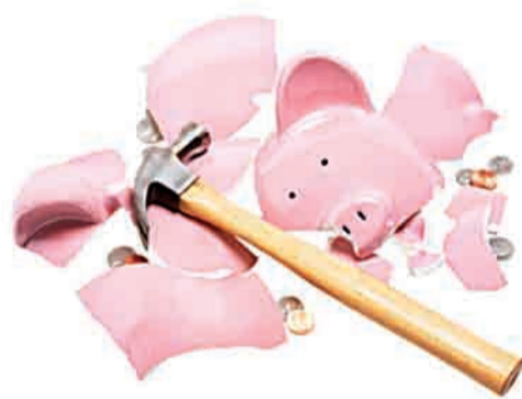
На халяву надейся, но и сам не плошай

Эта гипотеза, кстати, подтверждается тем, что по сравнению с предыдущим опросом