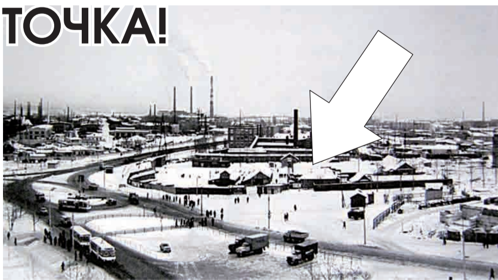
Насиженное место - около сорока лет назад.

«И что же, Юрий Андриянович, на реконструкции поставлена точка? Первоуральск останется совсем без рынка?»