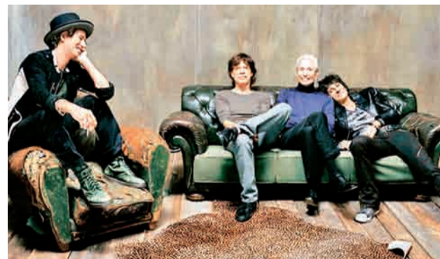
Ураган перекрёстного огня: под лежачих «Роллингов» вода не течет