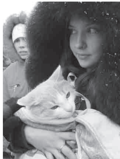
Бело-рыжий кот на руках у новой хозяйки

Вот и в этот раз, несмотря на погоду, вокруг наших столов, клеток и манежа со щенками собралось большое количество горожан, желающих помочь или взять себе котенка или щенка.