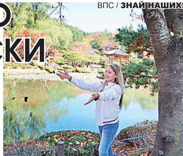
На фоне природных красот Южной Кореи