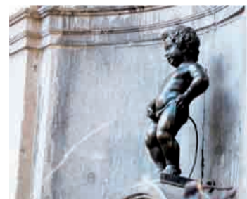
Пойти на преступление заставила нужда

Назначать такое наказание может только суд. Но подвести хулигана под статью будет трудно: достаточно поймать на месте нарушения и составить протокол. За сопротивление полиции наказание будет строже.