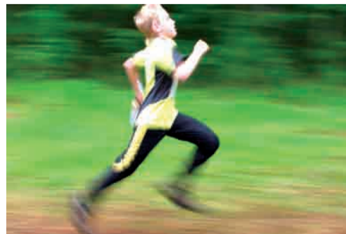
Фото из цикла «Промзона» и из фоторепортажей со Дня Победы и с соревнований по спортивному ориентированию