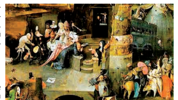
Иероним Босх, «Искушение св.Антония» (фрагмент)

Искушение с церковнославянского переводится как «испытание».