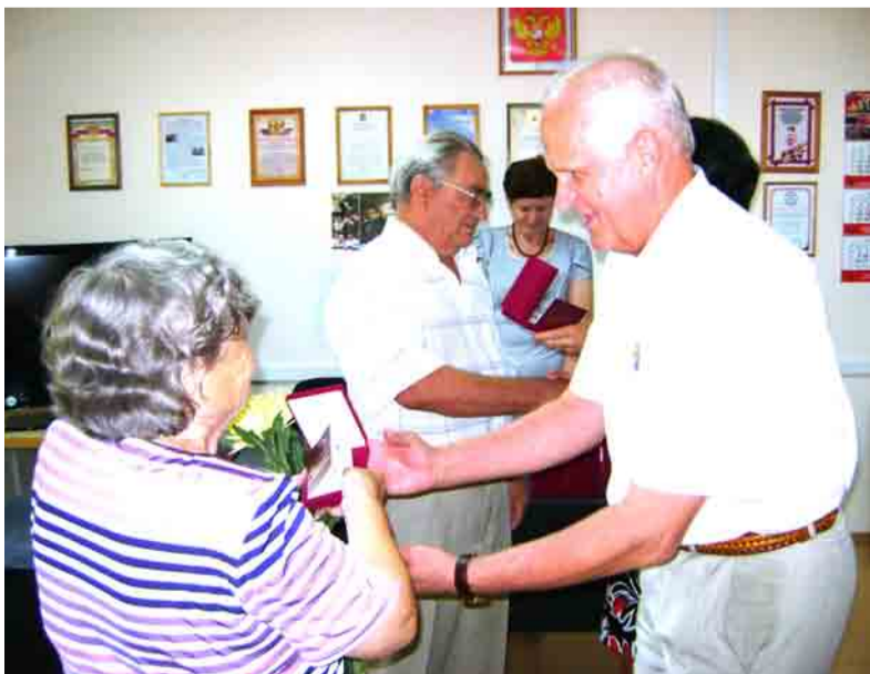
Торжественное вручение знака "Совет да любовь" в городском совете ветеранов