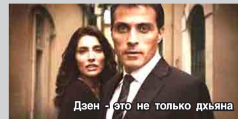
Дзен - это не только дхьяна