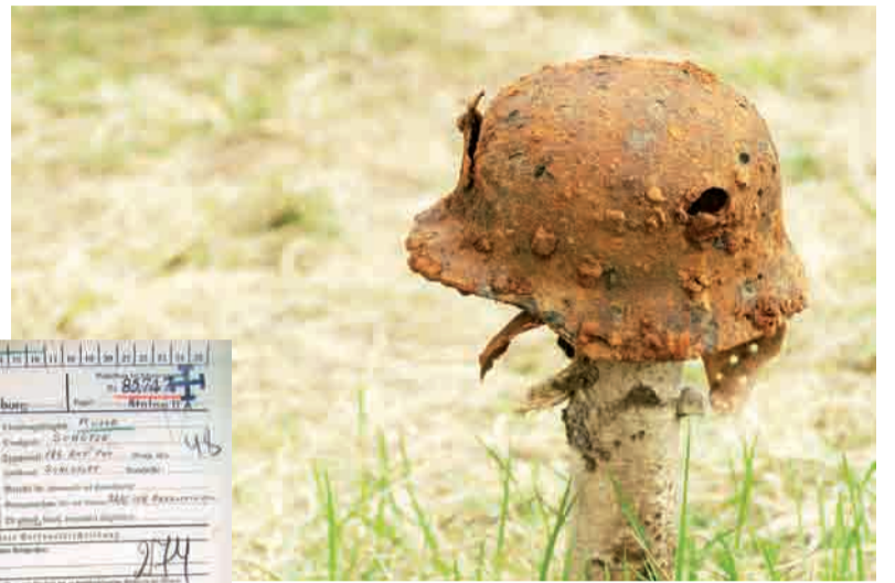
Эта немецкая проржавевшая каска найдена нашими поисковиками на Смоленщине в местах ожесточенных боев. Как напоминание о прошлом.

Одну из глав этих исторических мемуаров автор назвал: “Маленькие радости. Лагерь без клопов”