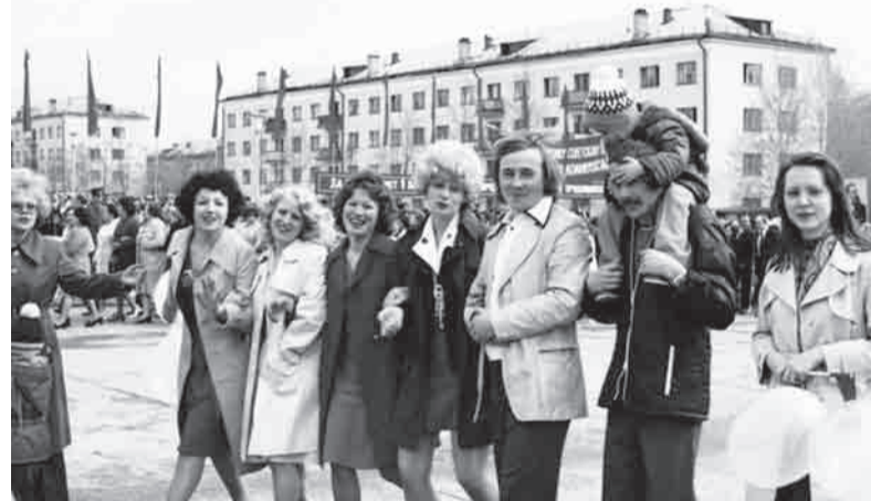
Как молоды мы были! Транспаранты и прямолинейные коммунистические лозунги, многочисленные портреты старцев из Политбюро все же не мешали нам жить и улыбаться от души. Особенно весной. Горожане на первомайской демонстрации 1977 года.

Дело в том, что Ильич прямо указывал распростертой рукой в сторону... города мертвых. Но однажды нас вдвоем отправили освещать - впервые в истории газеты - Радоницу, один из главных родительских дней.