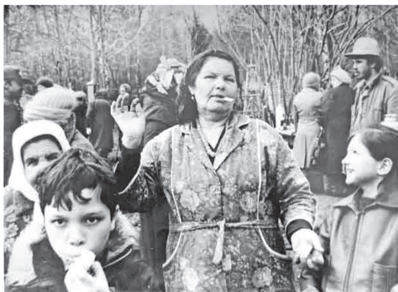
В первых воротах городского кладбища в родительский день. Цыгане шумною толпою... Начало 80-х.